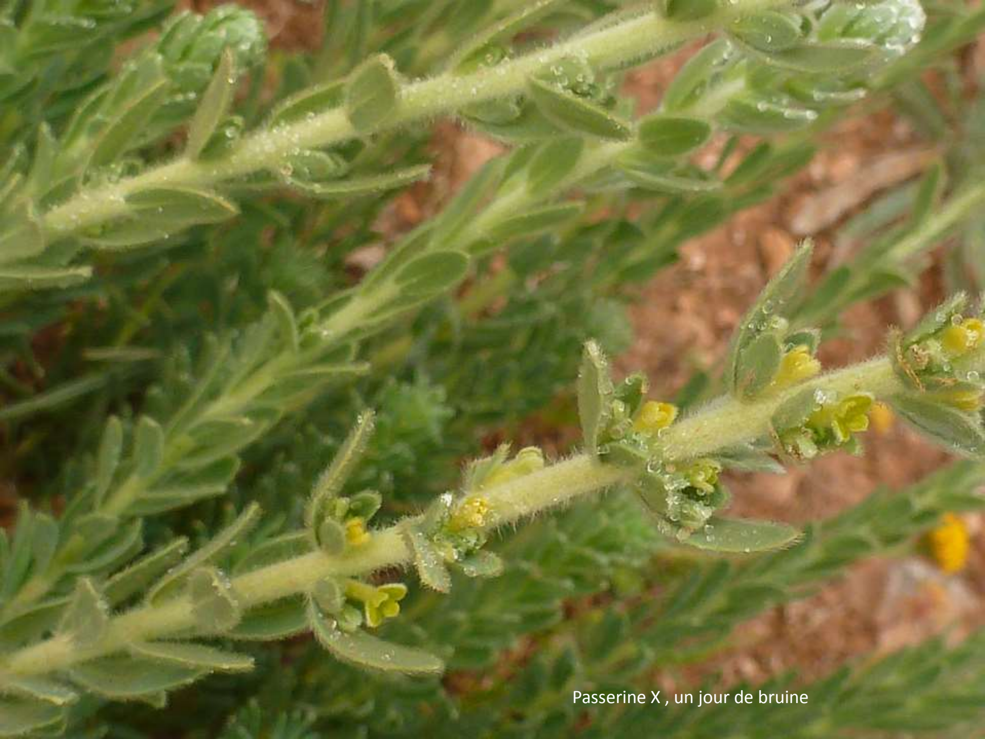
Passerine X , un jour de brume