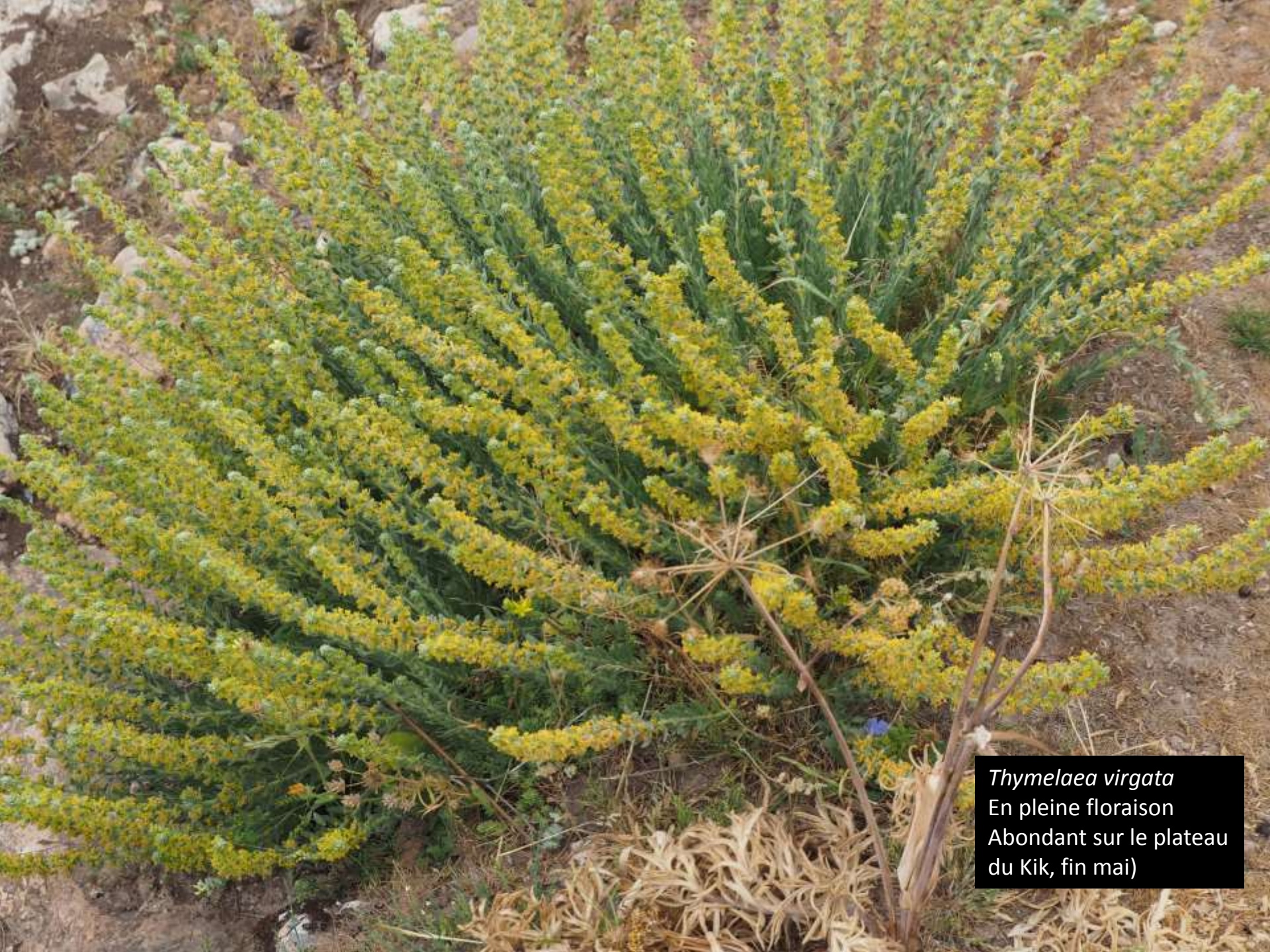
Thymelaea virgata En pleine floraison Abondant sur le plateau du Kik, fin mai)