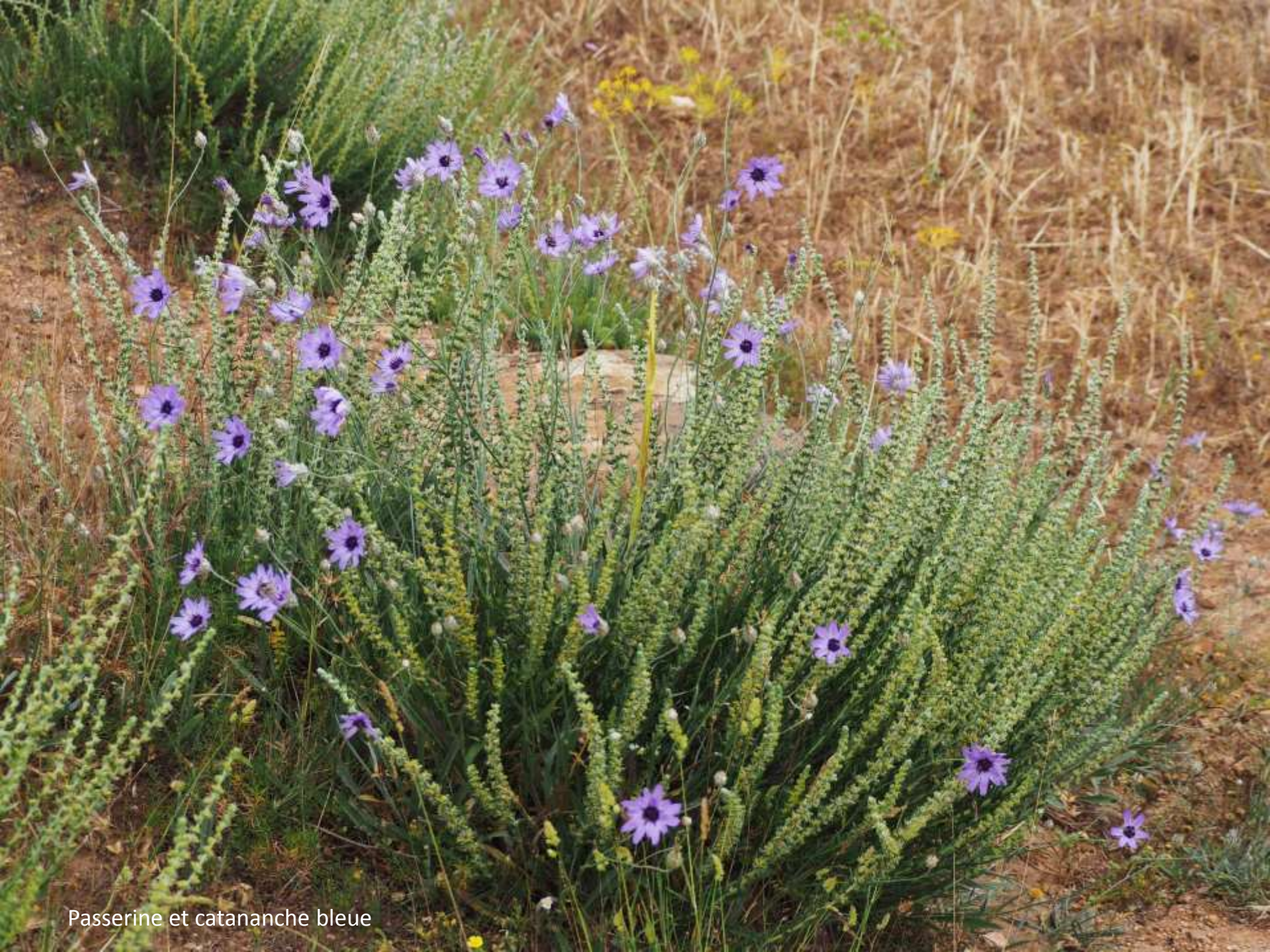
Passerine et catananche bleue