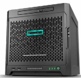
ProLiant Microserver Gen10