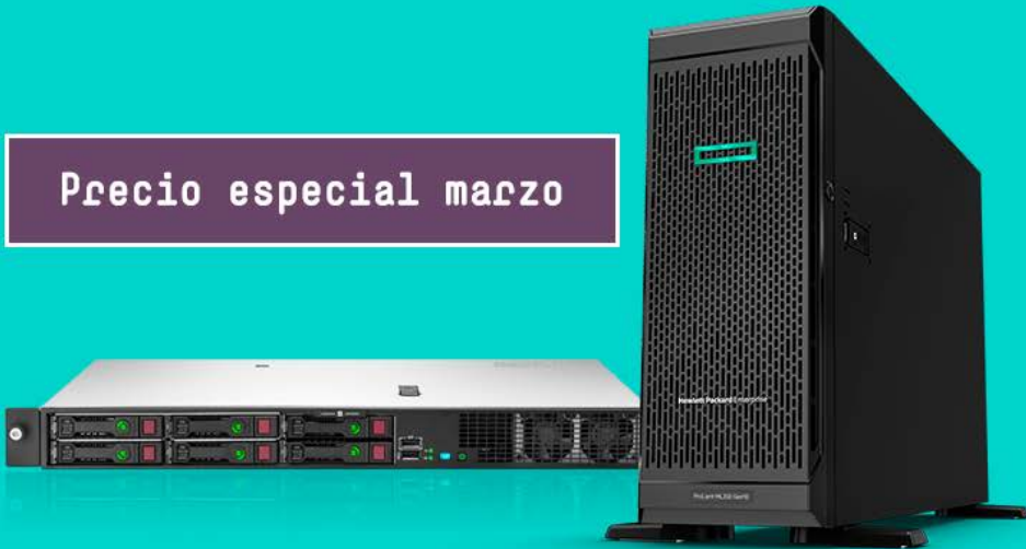
HPE ProLiant DL20 Gen10 Ref.: P06477-B21