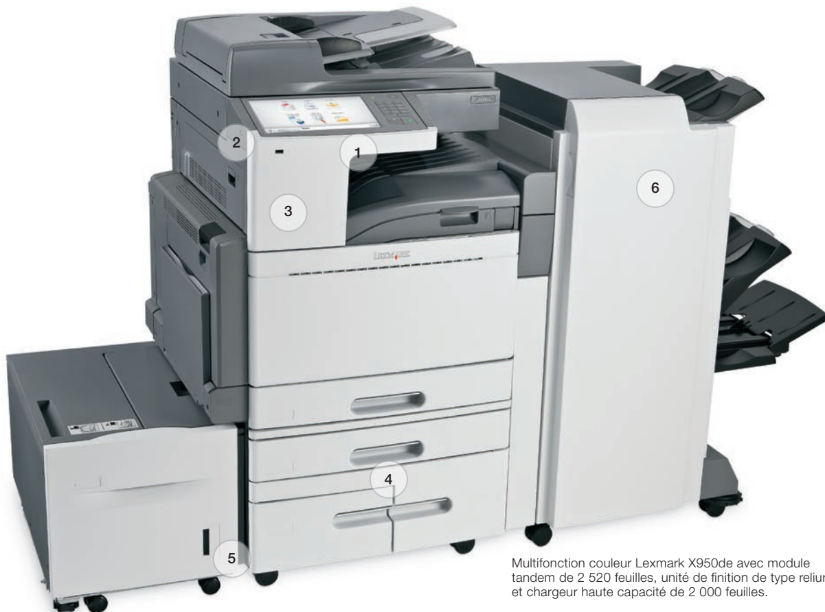
Multifonction couleur Lexmark X950de avec module tandem de 2 520 feuilles, unité de finition de type reliure et chargeur haute capacité de 2 000 feuilles.