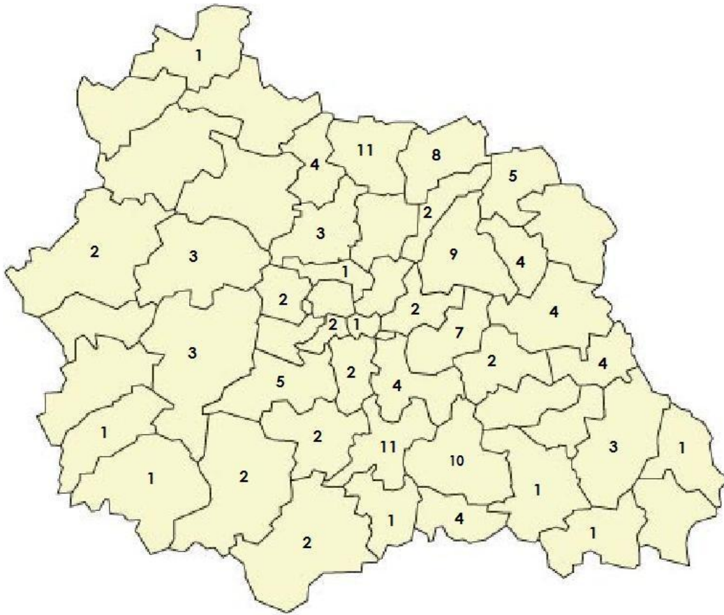
Carte 5 : Puy-de-Dôme, répartition des chantiers et des projets par cantons