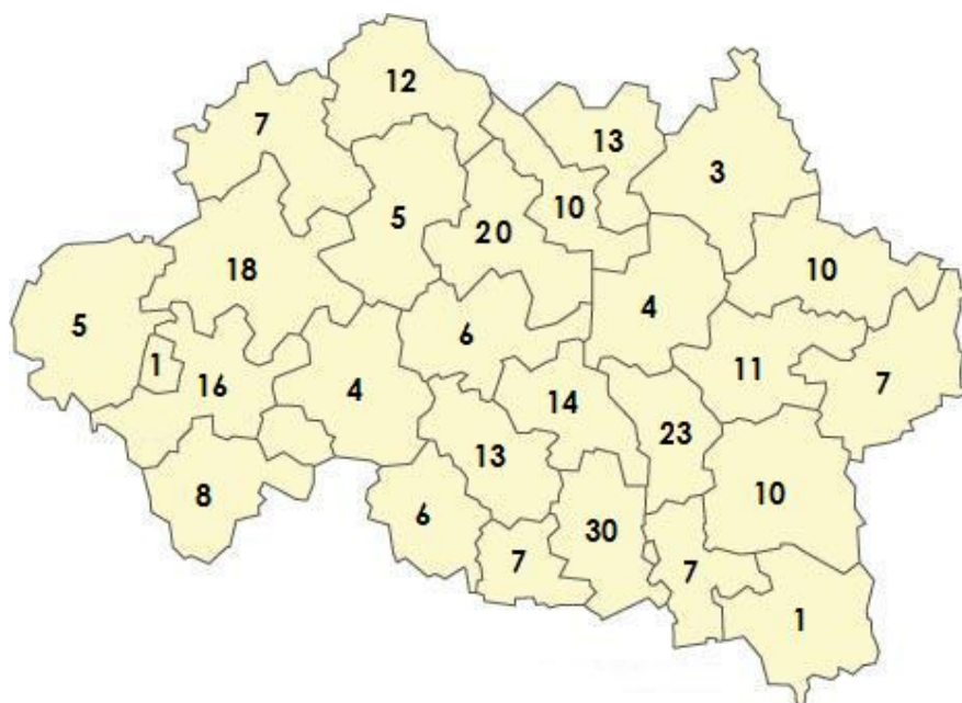
Carte 3 : Allier, répartition des chantiers et des projets par cantons