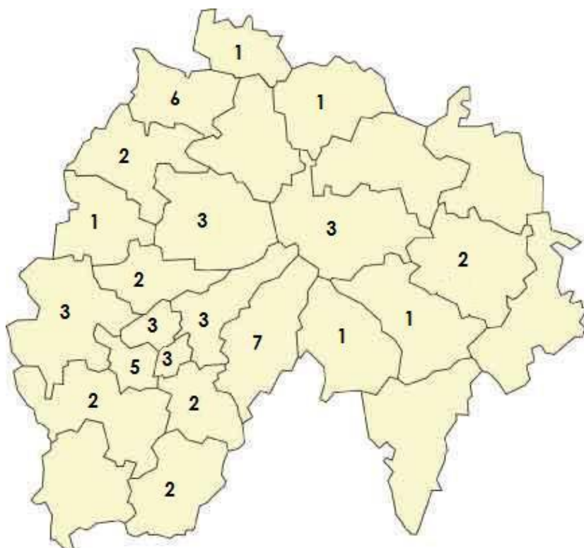
Carte 4 : Cantal, répartition des chantiers et des projets par cantons