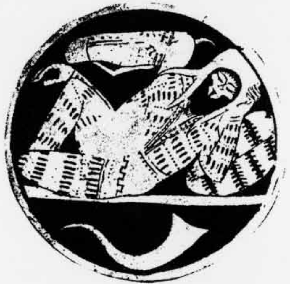
b : Scythe endormi après boire. Coupe à figures rouges. Collection privée suisse, AM 90 (1975), pl. 35,1.