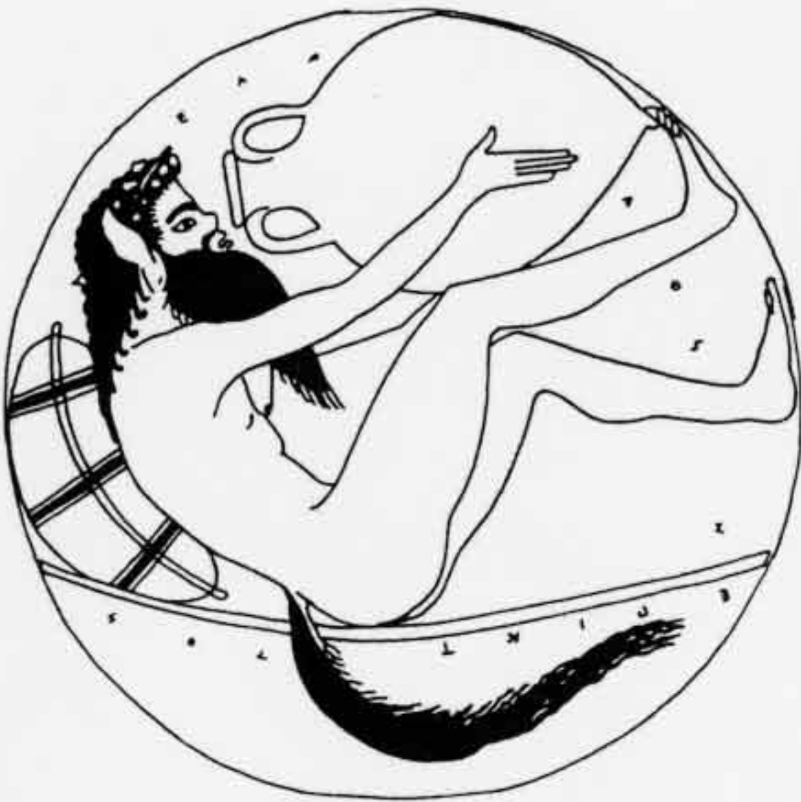
a : Satyre buvant à même l'amphore. Coupe à figures rouges signée Epictétos : ARV 75/56 (d'après F. LISSARAGUE, Un flot d'images , p. 18, fig. 3).