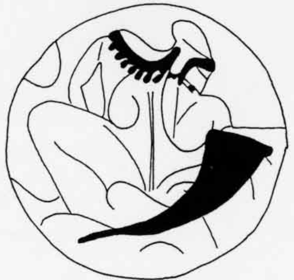
d : Silhouette de buveur avec bonnet scythe et corne à boire. Coupe de Rhodes 14115 ; ARV 140/26 (d'après F. LISSARAGUE, L'autre guerrier , p. 145, fig. 84).