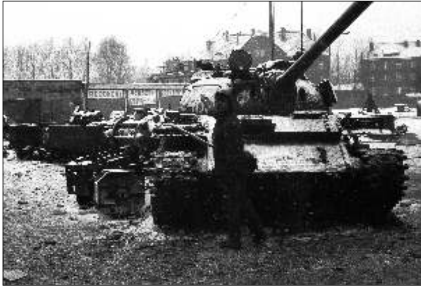
12. 1981. december 12. A hadiállapot kezdete a katowicei Wujek bánya előtt