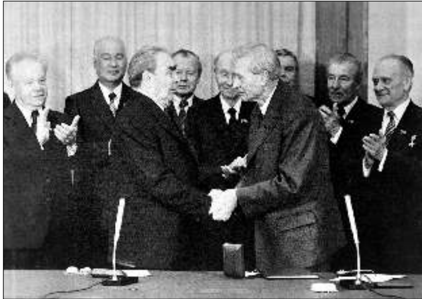
4. 1980. december 18. Leonyid Brezsnjev, amikor Mihail Szuszlov átadja neki az Októberi Forradalom Érdemrendet. Moszkva