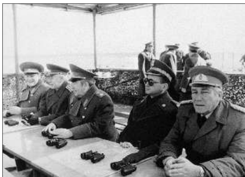
7. 1981. március 22. Szovjuz '81 törzsvezetési gyakorlat Lengyelországban. A képen balról jobbra Anatolij Gribkov, Martin Dzúr, Viktor Kulikov, Wojciech Jaruzelski, Heinz Hoffmann