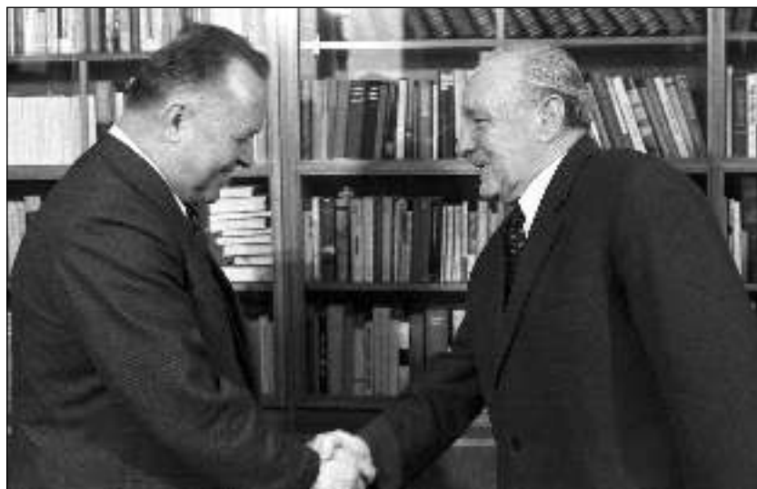
6. 1981. március 19. Kádár János fogadja Stanisław Kaniát Budapesten