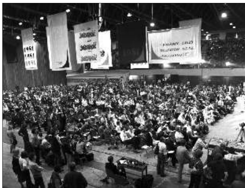
11. 1981. szeptember 7. A Szolidaritás I. országos kongresszusa a gdański Olivia Sportcsarnokban