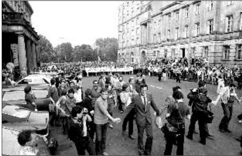
8. 1981. május 25. Tiltakozó diákok felvonulása varsói Bagiński utcában a Szent Anna-templom és az Ismeretlen Katona sírja között. A transzparensen „Szabadságot a politikai foglyoknak” felirat olvasható