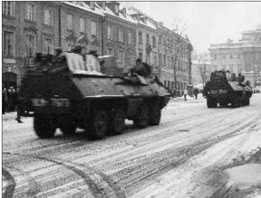
13. 1981. december 13. A hadiállapot bevezetése, Varsó