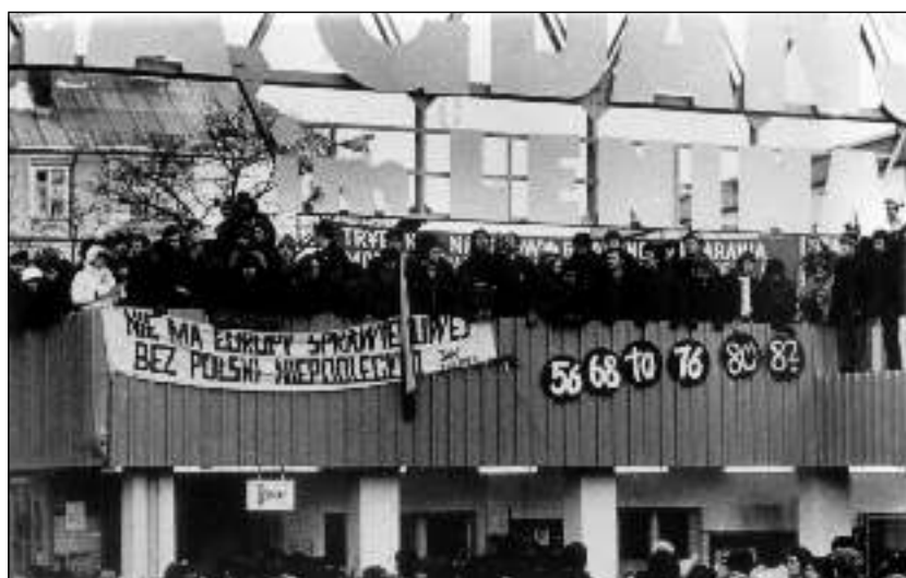
14. 1981. december 15. A gdański Lenin Hajógyár. Okkupációs sztrájk a hadiállapot bevezetése után. A felirat: „Nincs igazságos Európa független Lengyelország nélkül.” – II. János Pál pápa