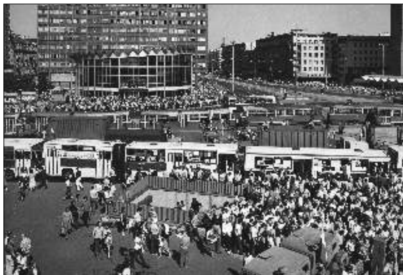
10. 1981. augusztus 3–5. A tömegközlekedési dolgozók blokádja Varsó belvárosában