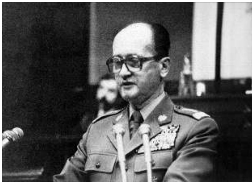
5. 1981. február 12. Wojciech Jaruzelski miniszterelnöki programbeszéde a Szejmben