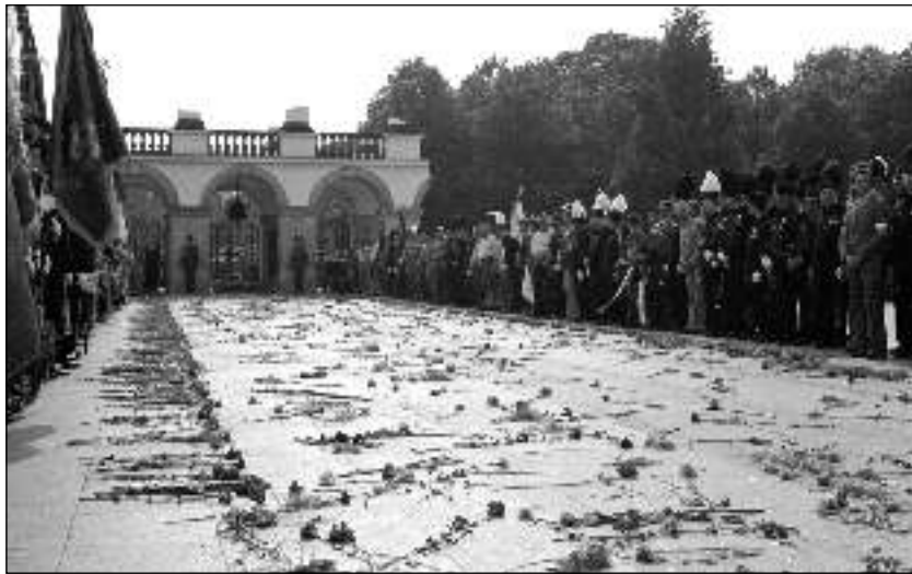
9. 1981. május 31. Stefan Wyszyński prímás temetése Varsóban. A bányászok delegációja az Ismeretlen Katona sírja előtt