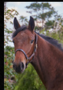
KRACK TIME D'ATOUT