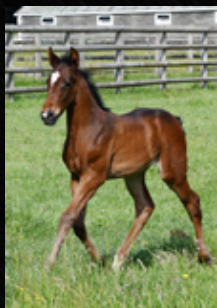
LEAVING NEW YORK