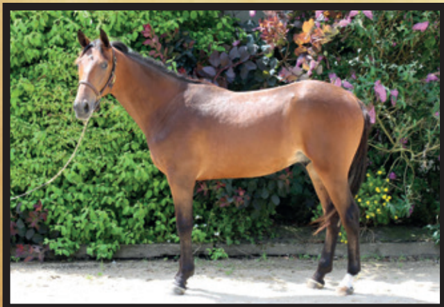
Mâle bai, né le 22/03/20