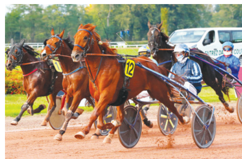
Empereur du Cebé