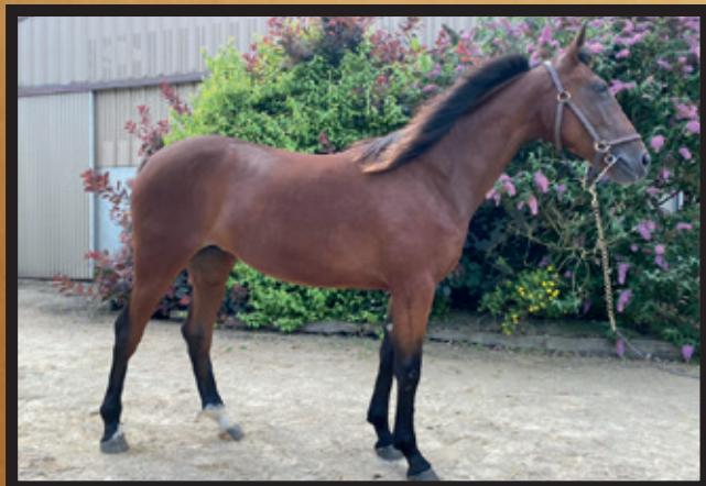
Femelle bai, née le 14/02/20