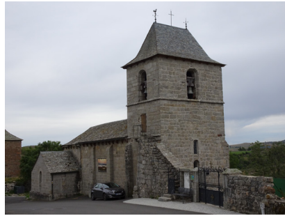
Église de Recoules d'Aubrac