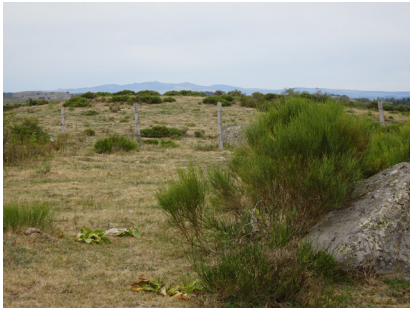
Au loin, les Monts du Cantal