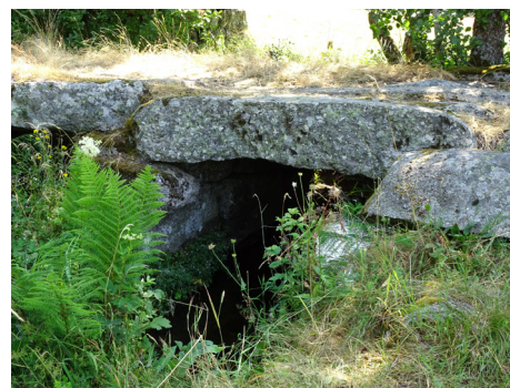
Pont de granite

7 La prendre à gauche sur quelques mètres puis s'engager dans le premier chemin à droite. Le suivre et atteindre la D 12. L'emprunter à droite (⚠ > prudence !) pour rejoindre La Chaldette.