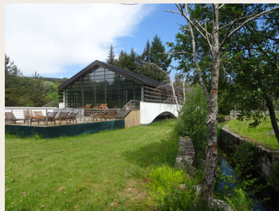
Les thermes de La Chaldette

sont recommandées pour le traitement des voies respiratoires et celui des affections digestives et métaboliques. Ce centre de remise en forme - espace de cure, situé sur le GR® de Pays Tour des Monts d'Aubrac , possède une résidence thermique et des hébergements pour les randonneurs.