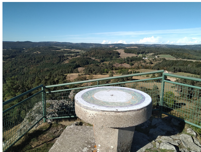
Sommet du Roc de Peyre