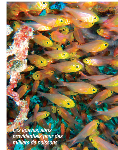
Les épaves, abris providentiels pour des milliers de poissons.

Depuis 2008, Bleu Autrement propose des séjours guidés sur mesure vers des destinations peu fréquentées, dont Bonaire, Saint-Eustache, l'Arabie Saoudite, le Soudan, le Mozambique, l'Afrique du Sud, Oman, le Mexique... En 2019, une nouvelle croisière aux Maldives est au programme pour la fin de l'année, avec un programme spécial pour les photographes. Présentation des activités et réponses à vos questions sur www.bleu-autrement.com ou avec Serge, son dirigeant, au 0622509216