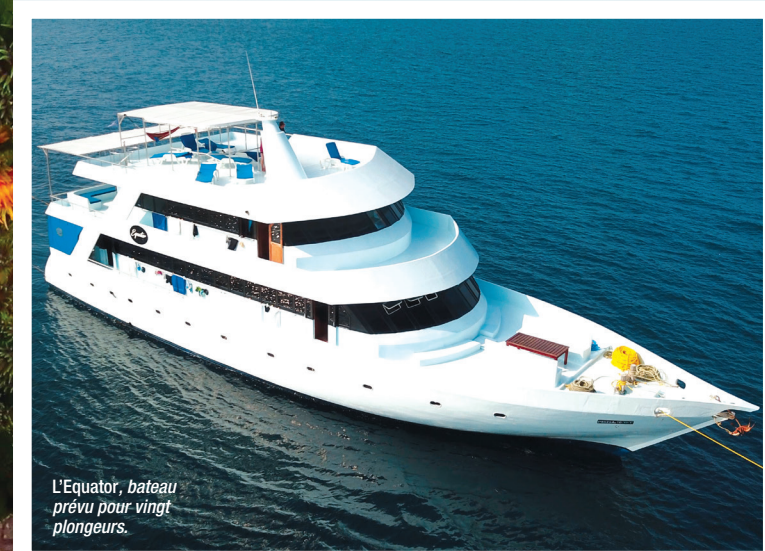
L'Equator, bateau prévu pour vingt plongeurs.