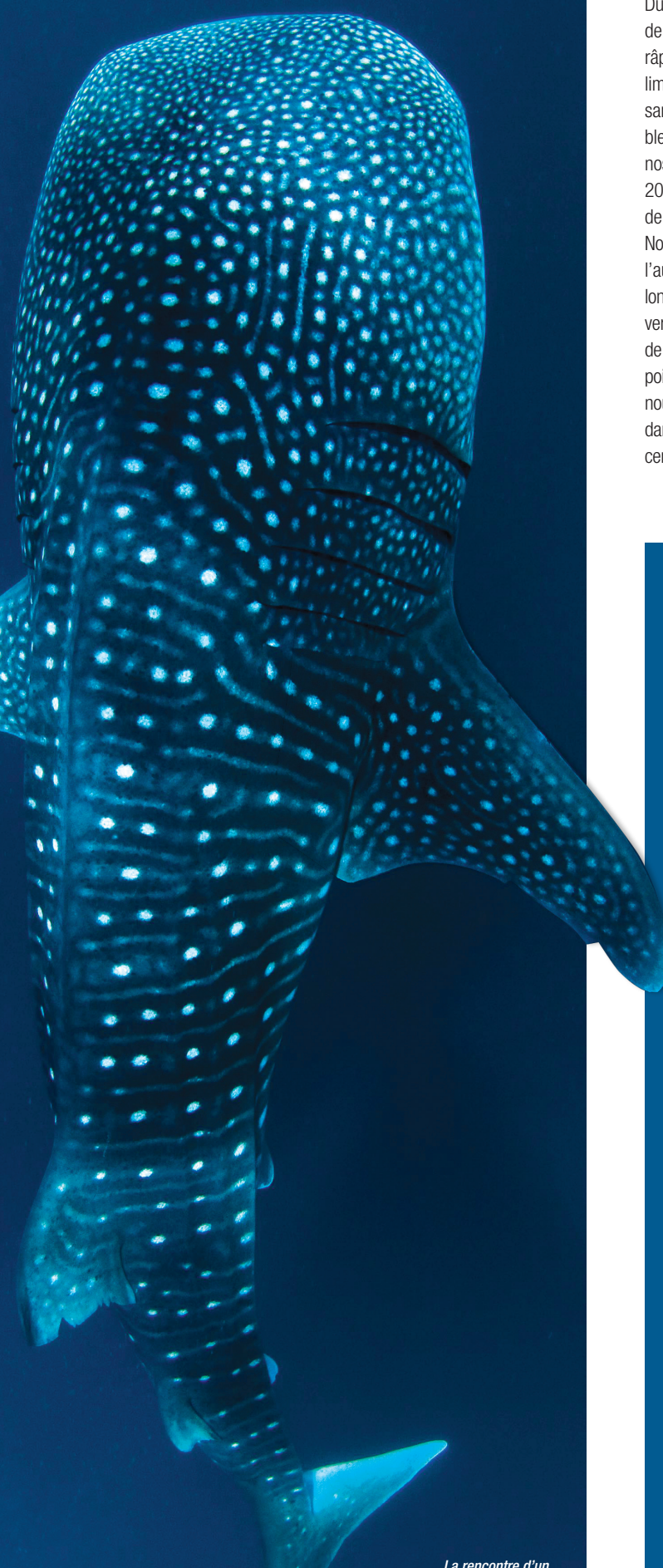
La rencontre d'un requin-baleine ? Une attente souvent récompensée.