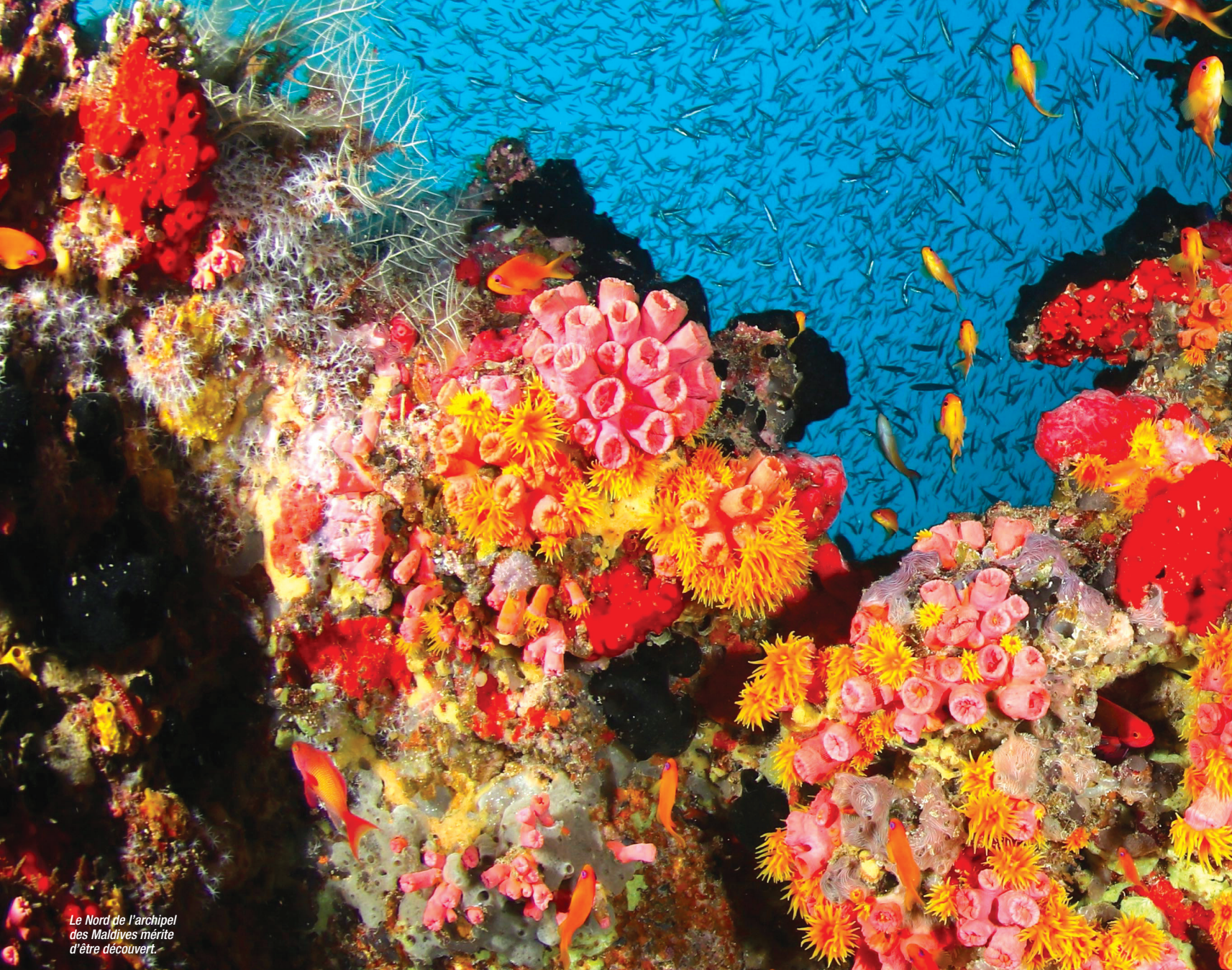
Le Nord de l'archipel des Maldives mérite d'être découvert.