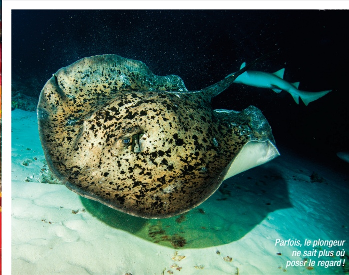
Parfois, le plongeur ne sait plus où poser le regard!