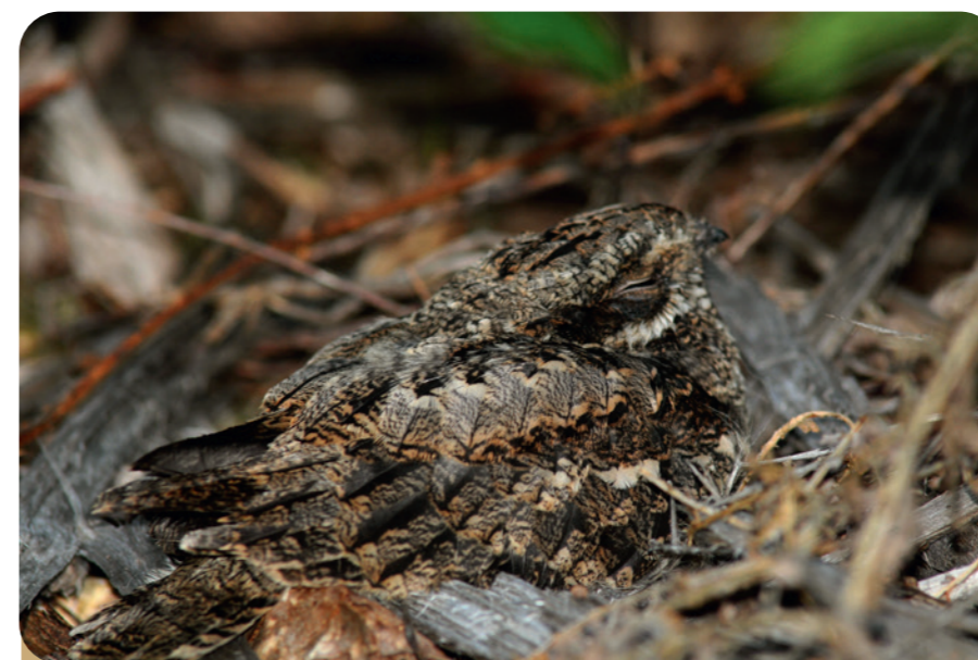
Engoulevent d'Europe. (PIERRE COUSIN)

L'effet lisière* des clairières forestières offre une grande variété d'habitats qui accueillent de nombreuses espèces végétales et animales. Les espèces animales y trouvent un abri et de la nourriture telle que les fleurs et les feuillages pour les insectes, ou les baies et les insectes pour les oiseaux et les chauves-souris. Les lisières forestières constituent également des lieux de circulation qui mettent en relation les différents milieux naturels du territoire. Elles jouent un rôle primordial dans la conservation de la biodiversité car elles assurent une transition entre deux types de milieux, et sont donc susceptibles d'accueillir des espèces vivant dans l'un ou l'autre de ces deux milieux.