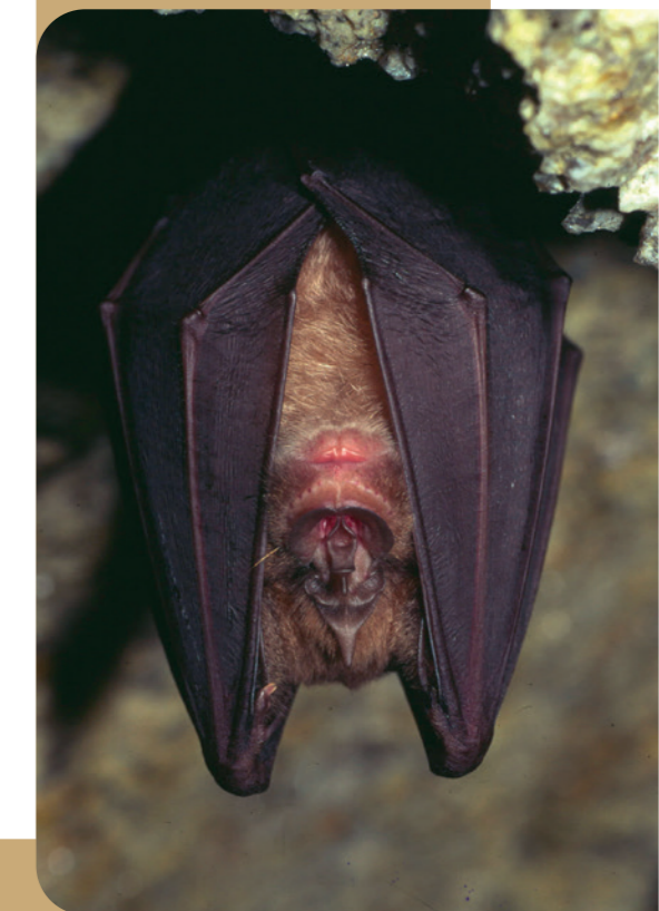
Grand rhinolophe appréciant les milieux forestiers pour la chasse. (CLAUDE GUIHARD)

*Une lisière est une limite entre deux milieux, dont l'un est généralement forestier, par exemple entre une forêt et une prairie, une clairière, etc.