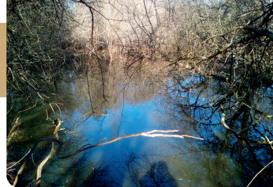
La mare avant travaux. (MORGANE REVOL)

*Une lisière est une limite entre deux milieux, dont l'un est généralement forestier, par exemple entre une forêt et une prairie, une clairière, etc.