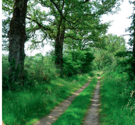
La destruction des haies, qui sont un habitat pour plusieurs espèces, est soumise à évaluation des incidences en site Natura 2000. (MORGANE REVOL)

Comment la réaliser ? Contacter l'animatrice Natura 2000 qui saura vous orienter et présenter les enjeux du site à prendre en compte lors du remplissage du formulaire d'évaluation des incidences.