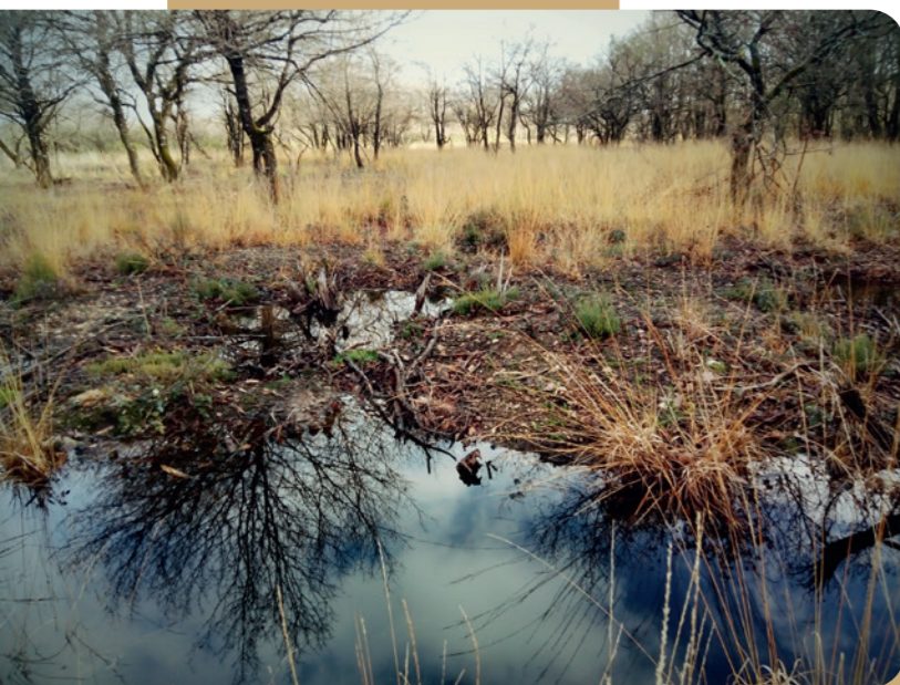
La brande repousse. (MORGANE REVOL)

Pour rappel, les mares sont des milieux transitoires qui ne peuvent se maintenir indéfiniment sans intervention : naturellement, la végétation qui s'organise en ceinture autour des mares se développe et progresse vers le centre. Dans le même temps, l'accumulation de débris végétaux et de sédiments minéraux vont en comblant le fond. Peu à peu, les mares disparaissent pour laisser la place à des buissons. Des travaux s'avèrent donc nécessaires pour garder les mares en eau et entretenir ce milieu qui demeure l'habitat de prédilection du Triton crêté.