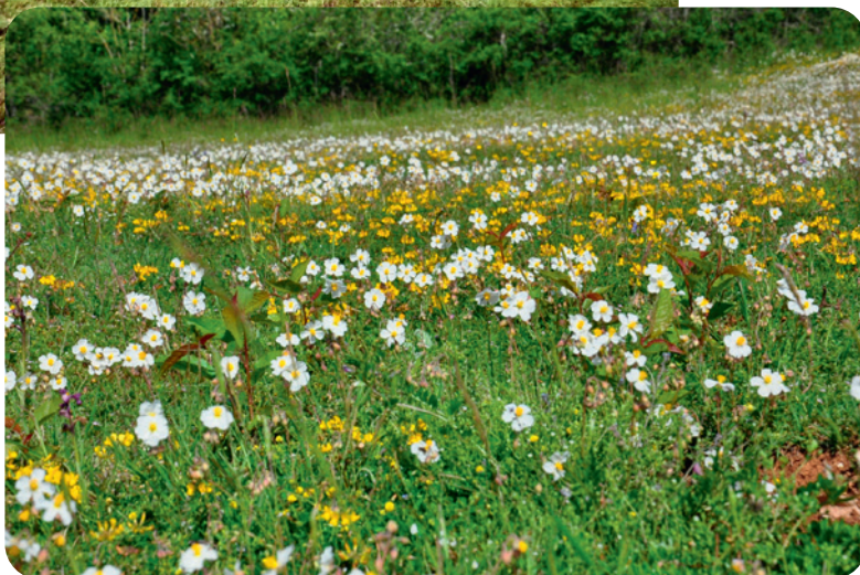
Pelouses calcaire du Lussacois. (MORGANE REVOL)