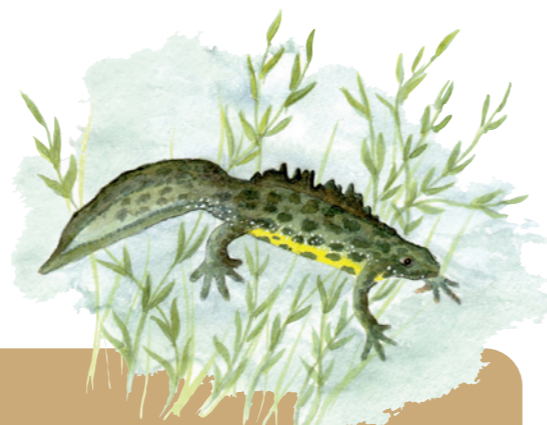
Triton crêté. (KATIA LIPOVOI)