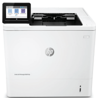
HP LaserJet Managed E60165dn