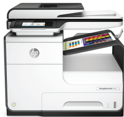
Imprimante multifonction HP PageWide Pro 477dw