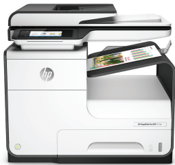
Imprimante multifonction HP PageWide Pro 477dn

Valeur optimale et vitesse — HP PageWide Pro offre le coût total de possession le plus bas et les vitesses les plus rapides de sa catégorie. 1,2 Bénéficiez d'une numérisation recto verso rapide, de fonctions de sécurité de pointe et d'une excellente efficacité énergétique. 3,4