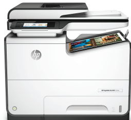
Imprimante multifonction HP PageWide Pro 577dw