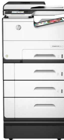
Imprimante multifonction HP PageWide Pro 577z