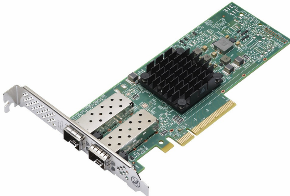
Figure 1. ThinkSystem Broadcom 57414 10/25GbE SFP28 2-port PCIe Ethernet Adapter

The following figure shows the 2-port adapter.