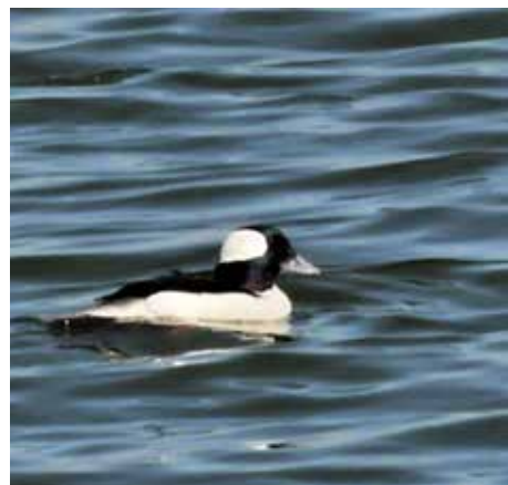
Le Petit Garrot mâle.

La femelle a la tête brune, le dos gris-brun et la poitrine grise allant d'un dégradé de plus en plus foncé vers le ventre. On remarque une tache blanche sur les joues et un miroir blanc sur le bord de l'aile. Son bec est gris plus foncé que chez le mâle.