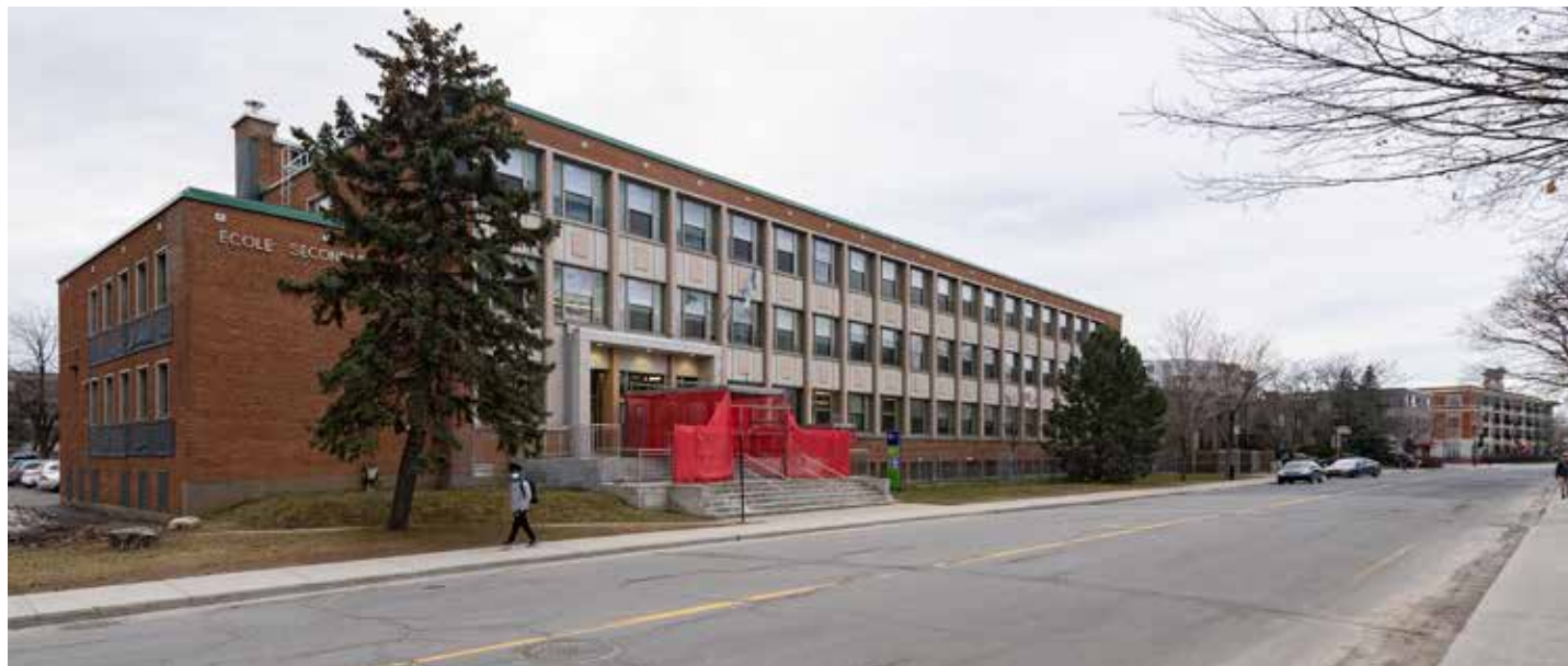
L'école québécoise est la plus inégalitaire au Canada.

Cette iniquité s'est malheureusement accrue ces dernières années : l'écart de réussite entre les élèves du réseau public et du réseau privé aux examens obligatoires du ministère de l'Éducation a atteint un sommet depuis cinq ans. Les