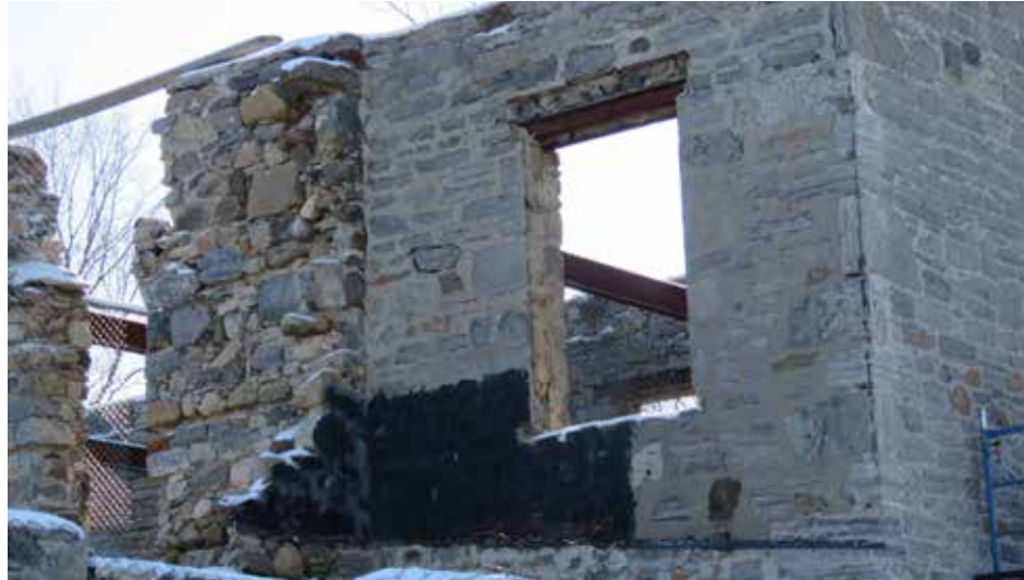
Externat de l'école Sophie-Barat en ruines.

Nous préparons un dossier sur le patrimoine en péril dans l'arrondissement. Mais pas juste le patrimoine : toutes les laideurs et tous les autres édifices décrépits nous intéressent.