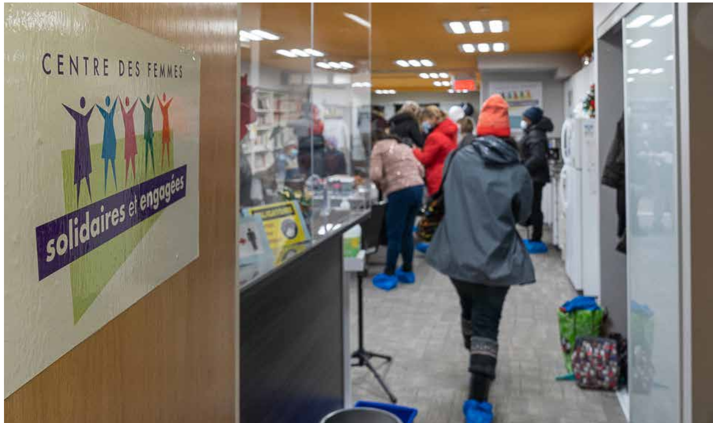
Le local du Centre des femmes solidaires et engagées (CFSE).

Des consultations gratuites avec une avocate sont offertes aux femmes, afin qu'elles puissent se renseigner sur leurs droits. Le centre se penche aussi sur la violence faite aux femmes.