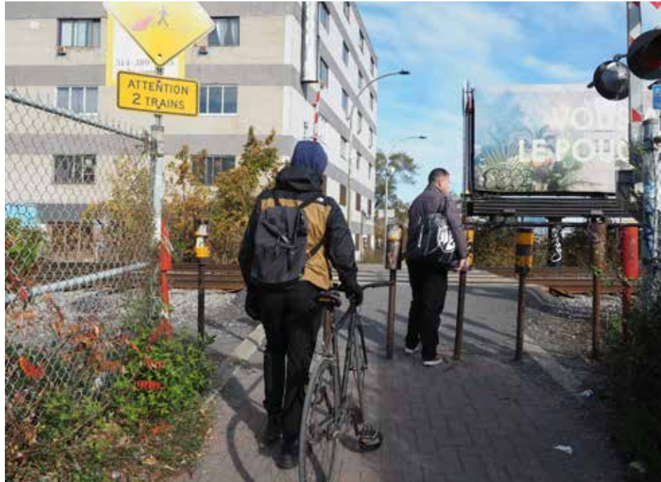
La traverse piétonne et vélo du chemin de fer du train de banlieue vers Saint-Jérôme, à la hauteur du boul. Crémazie (Photo : Camille Vanderschelden, JDV).

Avec le prix élevé de l'essence et du transport collectif, les modes actifs de déplacement se présentent souvent comme la solution la plus rentable.