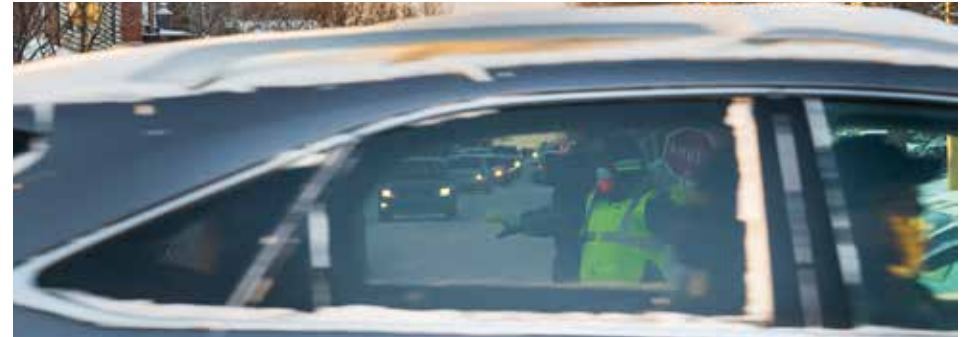
Ahuntsic-Cartierville a été développé autour de l'auto solo.

Ces gens-là ne respectent rien, dit-on. Or, les cyclistes commettent en fait moins d'infractions que les automobilistes. Les infrac-