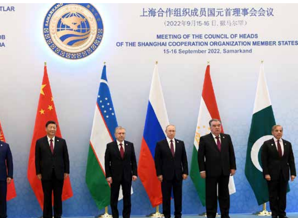
Les leaders des pays de l'Organisation de coopération de Shanghai à un sommet le 16 septembre 2022, à Samarcande, Ouzbékistan. De gauche à droite : Narendra Modi (Inde), Kassym-Jomart Tokayev (Kazakhstan), Sadyr Japarov (Kirghizstan), Xi Jinping (Chine), Shavkat Mirziyoyev (Ouzbékistan), Vladimir Poutine (Russie), Emomali Rahmon (Tadjikistan) et Shehbaz Sharif (Pakistan).

Taïwan, rappelle à cet effet une déclaration de Xi Jinping : « Nous ne renoncerons jamais à la force. »