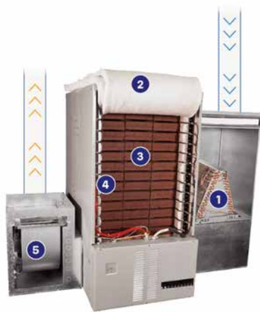
Photo d'un accumulateur de chaleur démontrant les composantes suivantes :

Les groupes qui ont commandé l'étude d'Écohabitation, soient le Syndicat canadien de la fonction publique (SCFP-