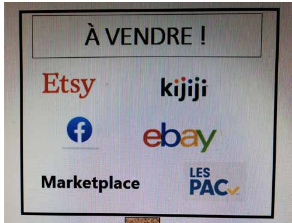
Quelques plateformes de revente qui vous permettront de bonifier votre budget cadeau. (Photomontage : Julie Dupont)

À part réduire notre consommation et travailler plus pour gagner plus, un autre moyen d'améliorer notre situation avec le temps des Fêtes qui approche est d'augmenter nos entrées d'argent. Comment? En nous défaisant de certains objets peu