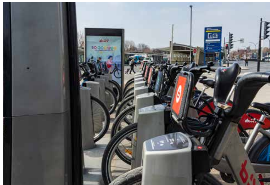
Un cocktail de transport peut remplacer l'auto.

À Ahuntsic, l'organisme LocoMotion offre l'autopartage le moins cher en ville. Une trentaine de propriétaires de véhicules (petite ou grosse voiture, auto électrique) prêtent gracieusement leur véhicule aux participants (on s'inscrit en ligne : locomotion.app). L'objectif est de diminuer le recours à la voiture individuelle. Le tarif, révisé semestriellement, ne couvre ainsi que l'essence, l'usure et la couverture d'assurance additionnelle.