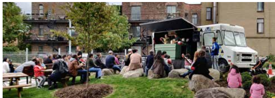
La troupe a converti en théâtre mobile un ancien camion de pompiers volontaires!

À l'origine de l'entreprise, trois lauréats de l'École nationale du théâtre du Canada,