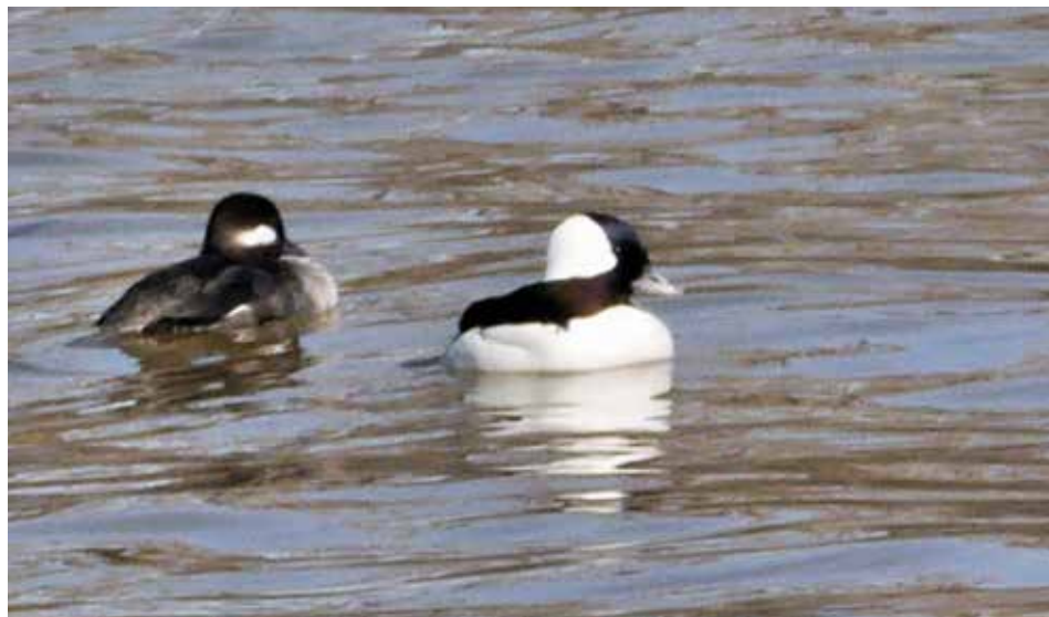
Un couple de Petits Garrots.

10 œufs pondus au rythme d'un par jour. La couvaison commence à la ponte