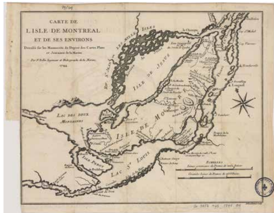
Carte de l'Isle de Montréal et de ses environs, par Jacques Nicolas Bellin et Guillaume Dheulland, Paris, 1744 (Collection BaNQ numérique)

tréal, nommée Tiohtià :ke en kanyen'kéha (langue mohawk), abréviation de Teionihiohtià :kon, « là où le groupe se scinde ou emprunte des chemins différents ».