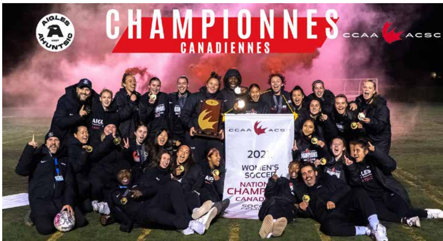
Les Aigles remportent la médaille d'or du championnat canadien.

La première division de soccer féminin du Collège Ahuntsic a fini sa saison en beauté en remportant la médaille d'or, lors du Championnat de l'Association canadienne du Sport collégial (ACSC).