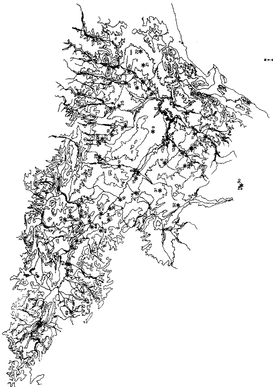
Mapa 1. Localización de las estaciones meteorológicas del cuadro 1.