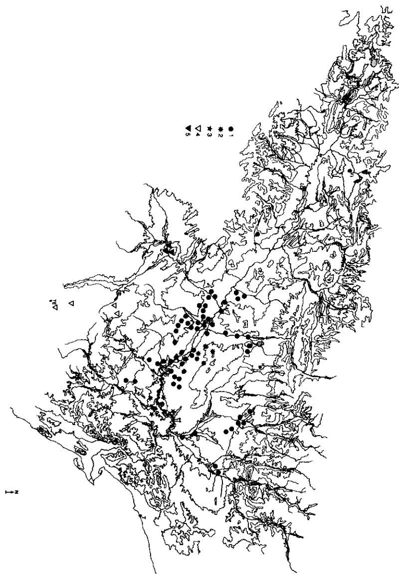
Mapa 3. Distribución de los inventarios correspondientes a los sintáxones: 1. Helianthemo-Gypsophiletum hispanicae typicum , 2. Helianthemo-Gypsophiletum salvietosum , 3. Helianthemo-Gypsophiletum boletosum , 4. Salvio-Gypsophiletum hispanicae typicum , 5. Salvio-Gypsophiletum sideritetosum spinulosae .