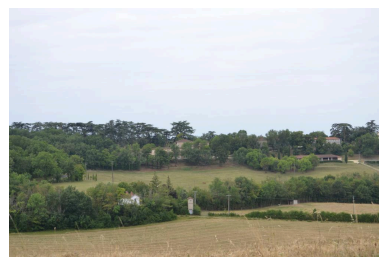
Vue générale depuis le nord. IVC32013_20193201589NUCA