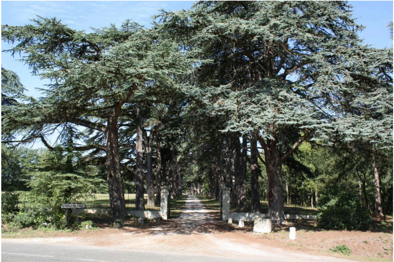
Entrée de l'allée, vue depuis l'est.