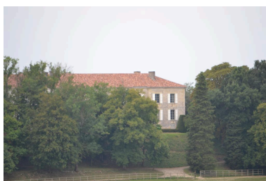
Château, vue depuis le nord. IVC32013_20193201591NUCA