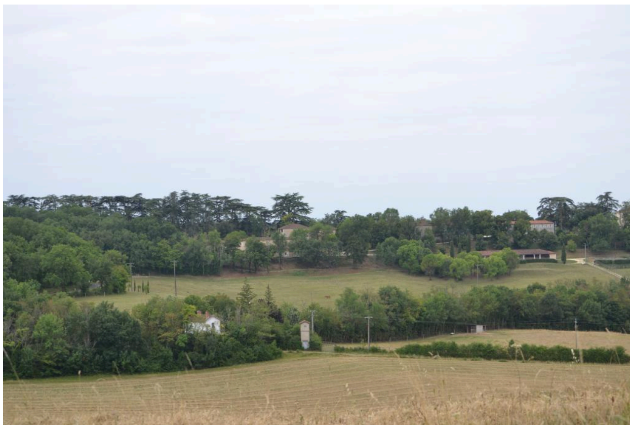
Vue générale depuis le nord.