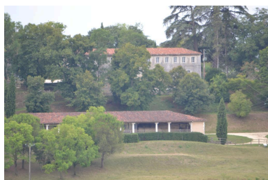
Communs, vue depuis le nord. IVC32013_20193201590NUCA