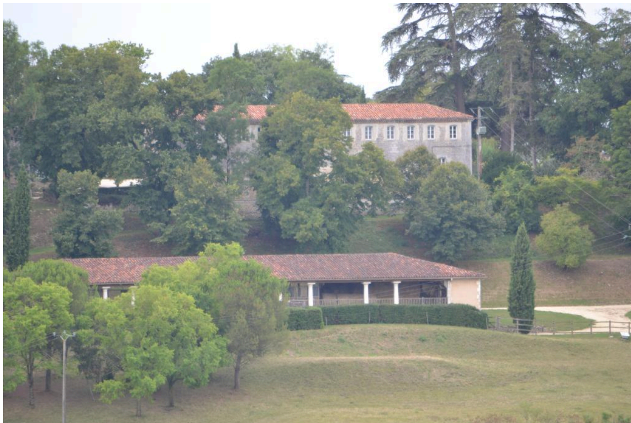
Communs, vue depuis le nord.