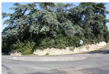
Parc, vue depuis le sud-est. IVD32_20123200341NUCA