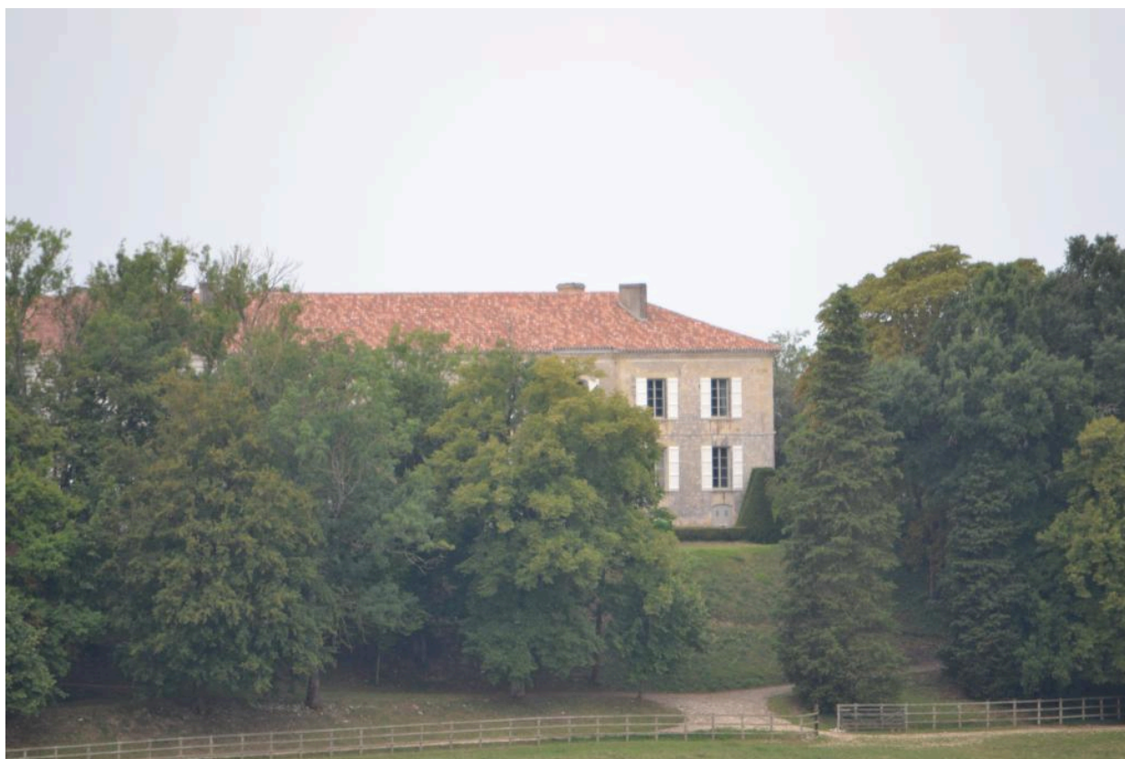
Château, vue depuis le nord.