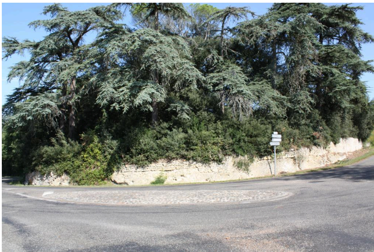
Parc, vue depuis le sud-est.