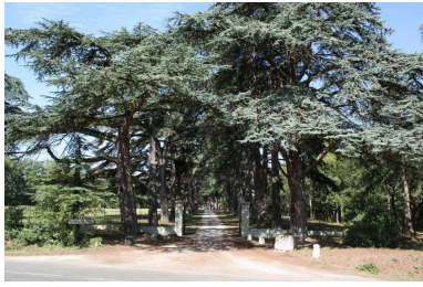
Entrée de l'allée, vue depuis l'est. IVD32_20123200340NUCA