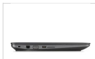
Right profile closed