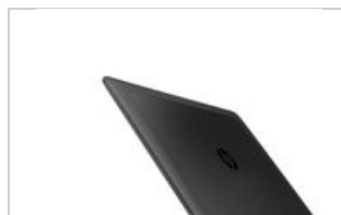
Left rear facing