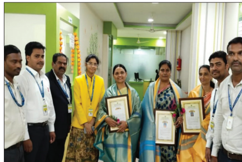
■ Karimnagar Branch (T.S.)