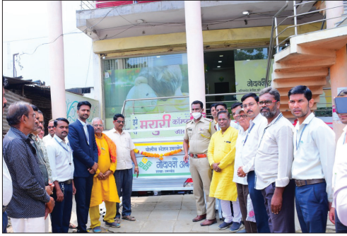
■ Barricades Distributed by Umarkhed Branch