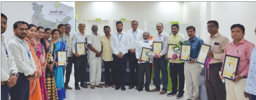
■ Hingoli Branch