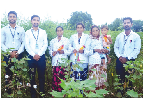
■ Succotes Distributed by Vasmata Branch