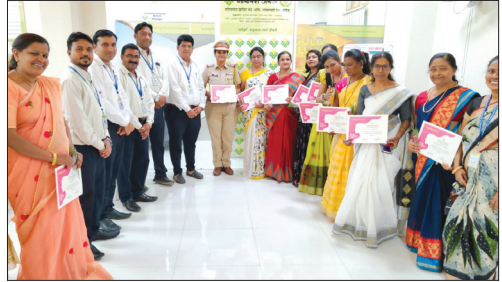
■ Darwha Branch