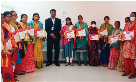
■ Manthani Branch (T.S.)