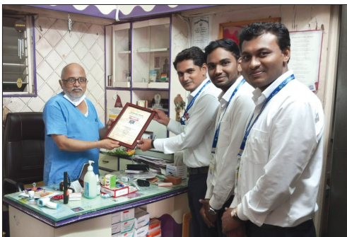
■ Dhamangaon Branch