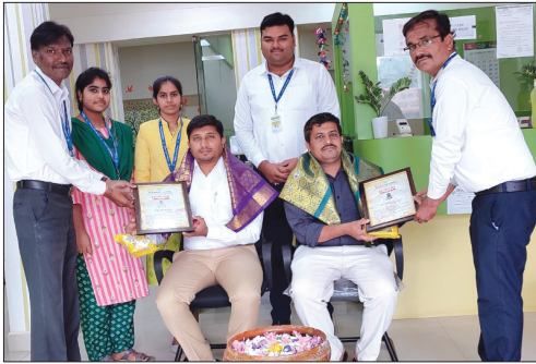
■ Hospet Branch (K.A.)