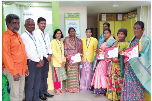
■ Peddapalli Branch (A.P.)