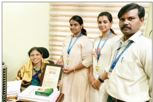
■ Bhimavaram Branch (A.P.)