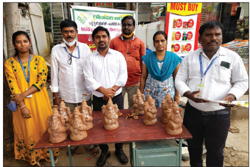
■ Eco friendly Ganesh Statue Distributed by Kadapa (A.P.) Branch