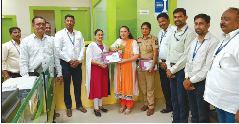
■ Wani Branch