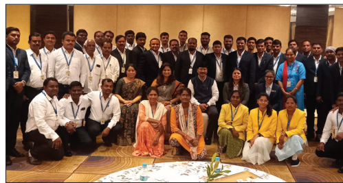
■ Telangana Region