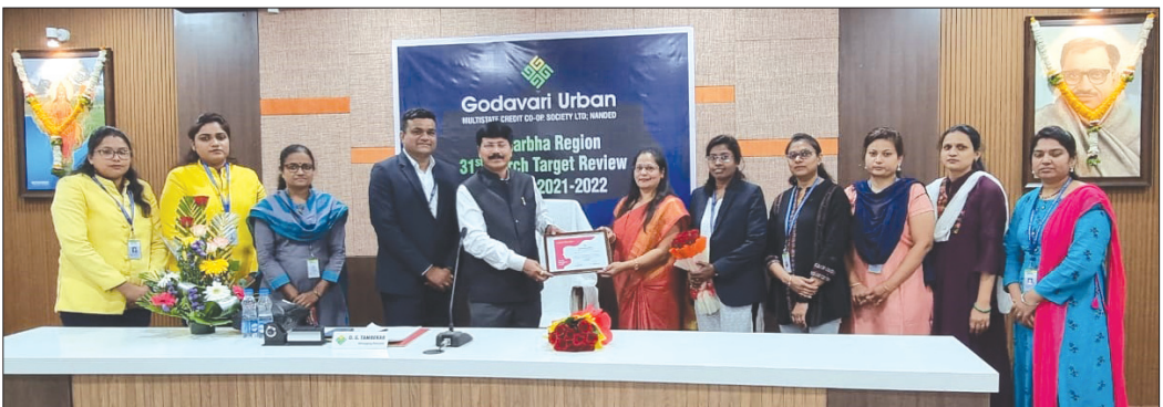
■ Yavatmal Region