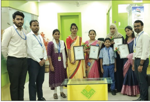
■ Hyderabad Branch (T.S.)