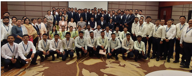
■ Nagpur Region