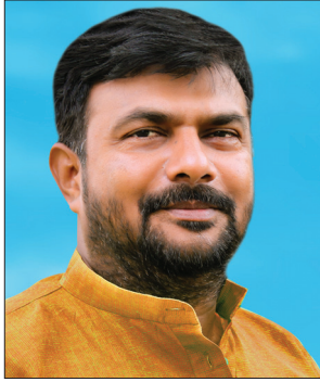
Hon. Hemant Shriram Patil Founder and MP