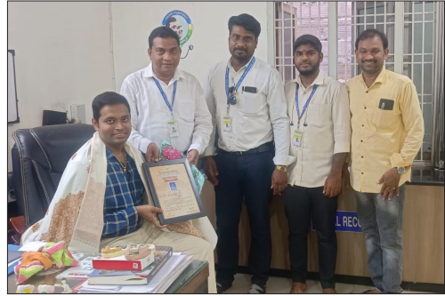
■ Amalapuram Branch (A.P.)