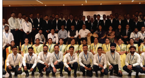
■ Nanded Region