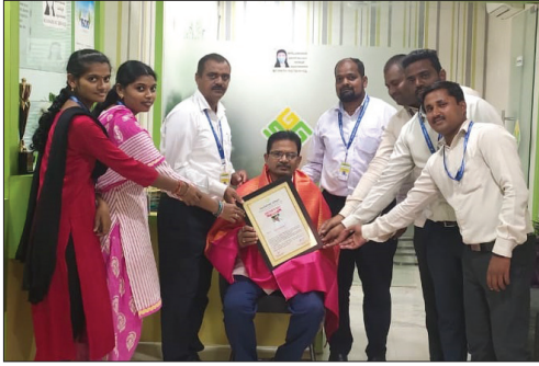
■ Sultanabad Branch (T.S.)