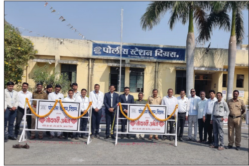
■ Barricades Distributed by Digras Branch