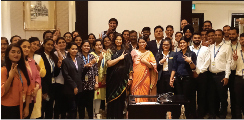
■ Mumbai Region