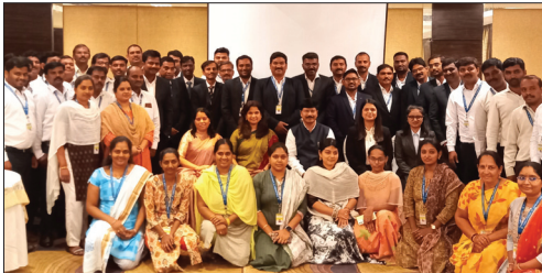
■ Andhra Pradesh Region