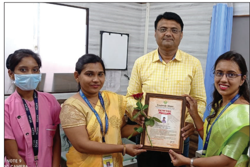
■ Wagholi (Pune) Branch