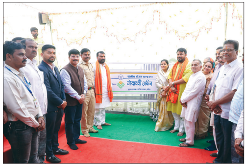
■ Barricades Distributed by Main Branch