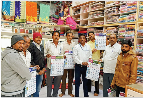
■ Calendar Distributed by Arni Branch