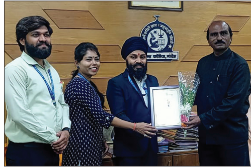
■ Chikhalwadi Branch