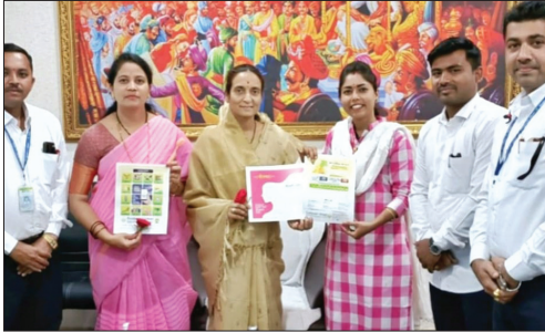
■ CIDCO Branch