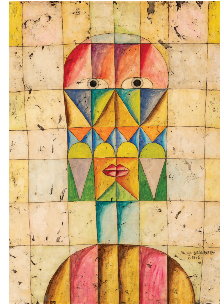
↓ Victor Brauner Palais de l'intelligence, mai 1956 peinture à la paraffine sur carton contrecollé sur isorel, 64 x 49 cm Fondation des Treilles