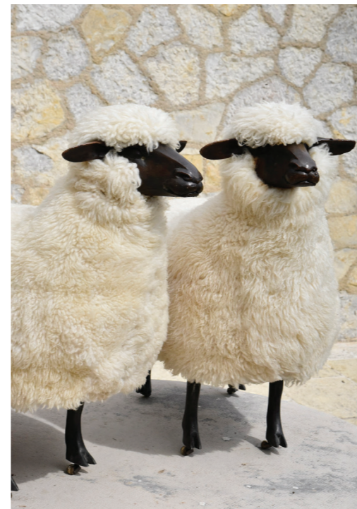
↑ François-Xavier Lalanne, Moutons avec tête , 1965 sièges en forme de mouton, cuivre galvanique, fonte d'aluminium, patine noire, bois, acier, peaux lainées de mouton, roulettes, 86 x 45 x 96 cm chacun Fondation des Treilles