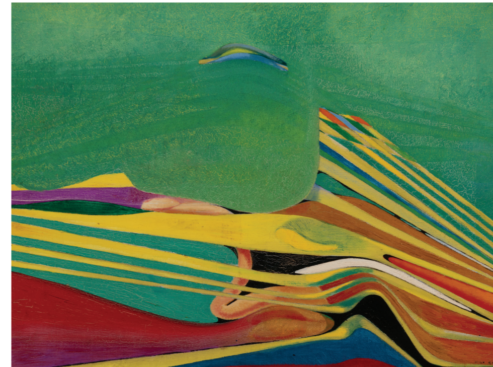
→ Max Ernst Paysage au germe de blé , 1934 huile sur toile, 60 x 81 cm Fondation des Treilles

Treasures from the Fondation des Treilles