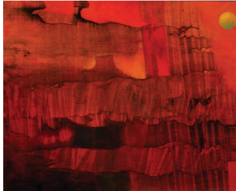
↓ Max Ernst Galápagos, 1955 huile sur bois, 33 x 41 cm Fondation des Treilles

Im ersten Halbjahr 2022 hat die Fondation de l'Hermitage die Ehre, zum ersten Mal in der Schweiz eine Auswahl der bedeutendsten Meisterwerke der Fondation des Treilles zu zeigen. Die Stiftung, deren Sitz in Tourtour in Südfrankreich ist, besitzt eine prestigeträchtige Sammlung, die von der visionären Kunstmäzenin Anne Gruner Schlumberger (1905-1993) geschaffen wurde und Werke von Hans Arp, Georges Braque, Victor Brauner, Jean Dubuffet, Max Ernst, Alberto Giacometti, Paul Klee, François-Xavier Lalanne, Henri Laurens, Fernand Léger, Pablo Picasso und Takis umfasst. Mit rund hundert Gemälden, Zeichnungen, Druckgrafiken, Skulpturen und Objekten bietet die in Lausanne gezeigte Schau die einmalige Gelegenheit, diese Schätze ausserhalb ihres üblichen Rahmens zu bewundern und dabei den Geschmack, die Persönlichkeit und die Künstlerfreundschaften einer der berühmtesten Sammlerinnen des 20. Jahrhunderts zu entdecken.