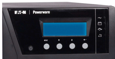
ЖК-дисплей с поддержкой русского языка