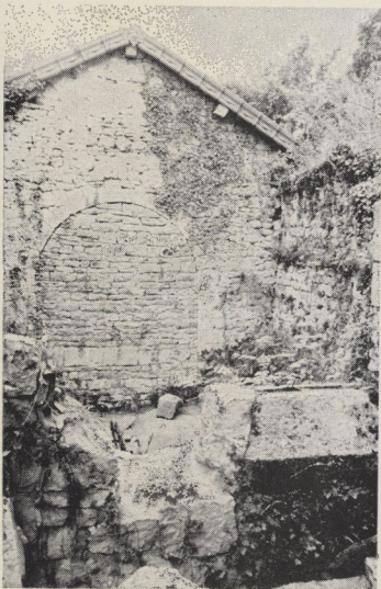
Une vue du chœur de la chapelle de Dramelay en 1976, tout est encore en ruines