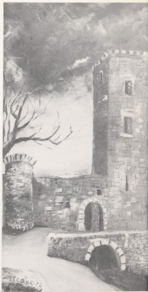
La Tour de Dramelay tableau M. François Decoe