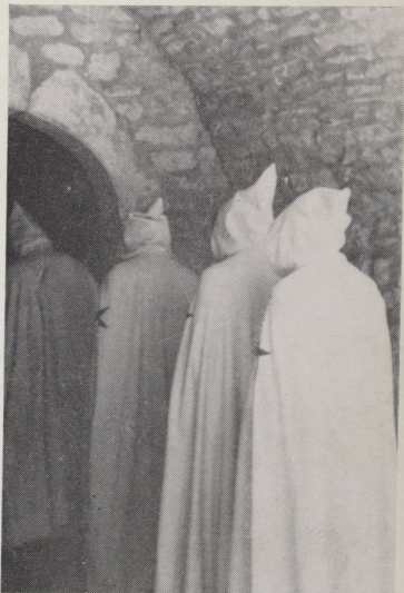
En 1973, le premier office templier célébré en public se déroule à Dramelay