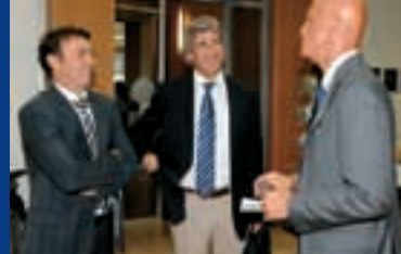
Le point de vue de l'arbitre donné aux techniciens: Pierluigi Collina (à droite) avec Abel Resino et Manuel Pellegrini.