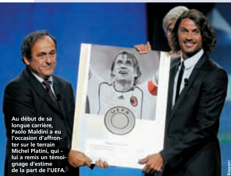
Au début de sa longue carrière, Paolo Maldini a eu l'occasion d'affronter sur le terrain Michel Platini, qui - lui a remis un témoignage d'estime de la part de l'UEFA.