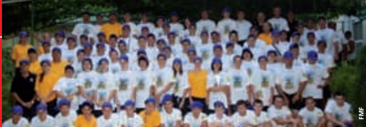
Moldavie Les participants des cours pour instructeurs.