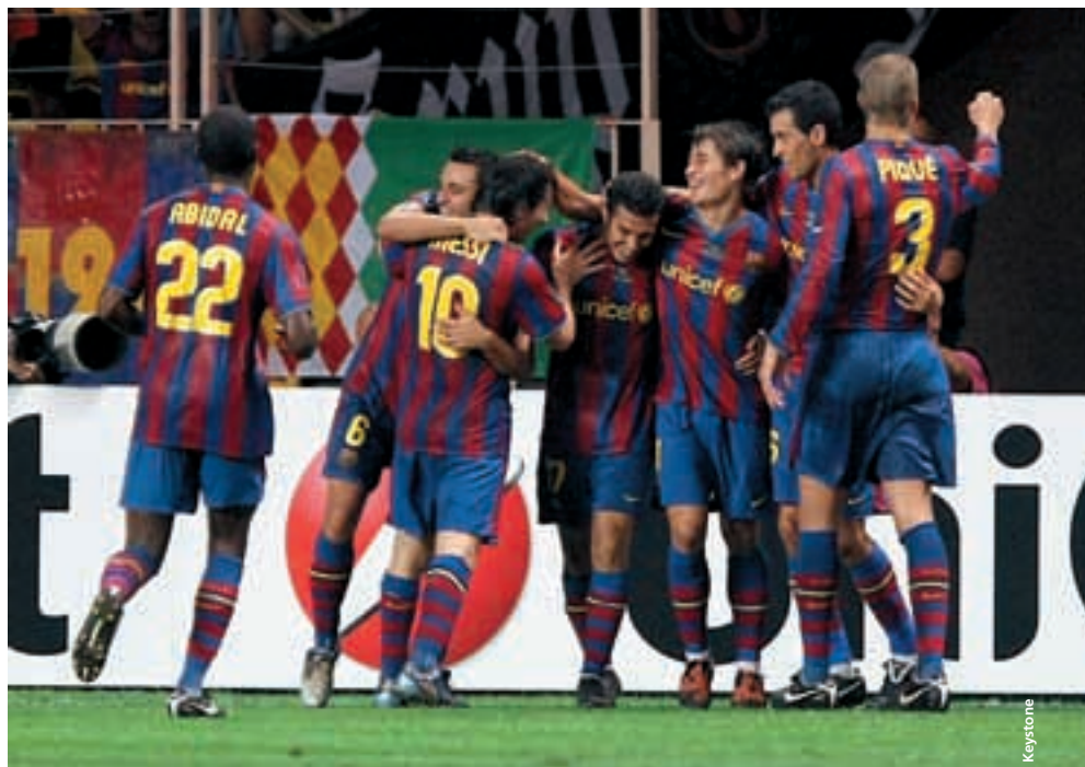
Grâce à sa victoire en Super Coupe de l'UEFA, le FC Barcelone a obtenu un chèque de 2,5 millions d'euros qui s'ajoute à ses gains en Ligue des champions.

En Coupe UEFA, Shakhtar Donetsk et Werder Brême ont reçu chacun 825 211 euros comme part de la recette de la vente des billets. Ce montant s'ajoute aux primes de 2,5 et 1,5 millions d'euros qu'ils ont obtenues