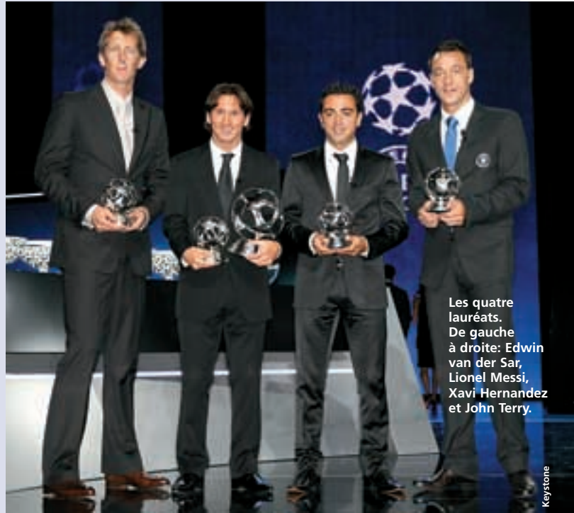
Les quatre lauréats. De gauche à droite: Edwin van der Sar, Lionel Messi, Xavi Hernandez et John Terry.

■ Comme ces deux dernières années, le meilleur attaquant a aussi été élu footballeur de l'année dans les compétitions interclubs de l'UEFA. Cette fois, c'est Lionel Messi , du FC Barcelone, qui a reçu ce double honneur. Le premier prix lui a été remis par l'ancien attaquant écossais de Manchester United Denis Law et le second, par le président de l'UEFA, Michel Platini.