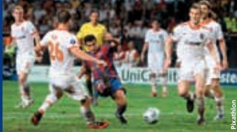
Un trophée de plus pour le capitaine Carles Puyol.