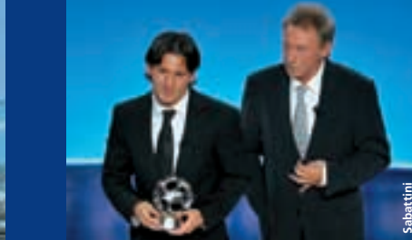
Lionel Messi a reçu son trophée de meilleur attaquant des mains de Denis Law.