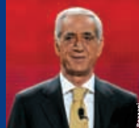
Yasar Mumcuoglu, premier buteur de la Coupe UEFA en 1971 avec Fenerbahçe, a également participé au tirage au sort.