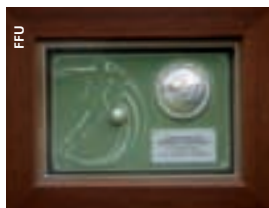
Ukraine Plaque souvenir du tournoi en l'honneur de Valery Lobanovsky.

Le trophée décerné au meilleur joueur de l'équipe nationale lors de l'EURO 2008 et des matches internationaux de la saison 2008-09, a été remis au champion d'Allemagne Diego Benaglio (25 ans) du VfL Wolfsburg. Le gardien de la sélection helvétique a devancé les autres nominés Valon Behrami (West Ham United), Blaise Nkufo (FC Twente) et Hakan Yakin (FC Lucerne).