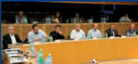
Echange entre techniciens au siège de l'UEFA.