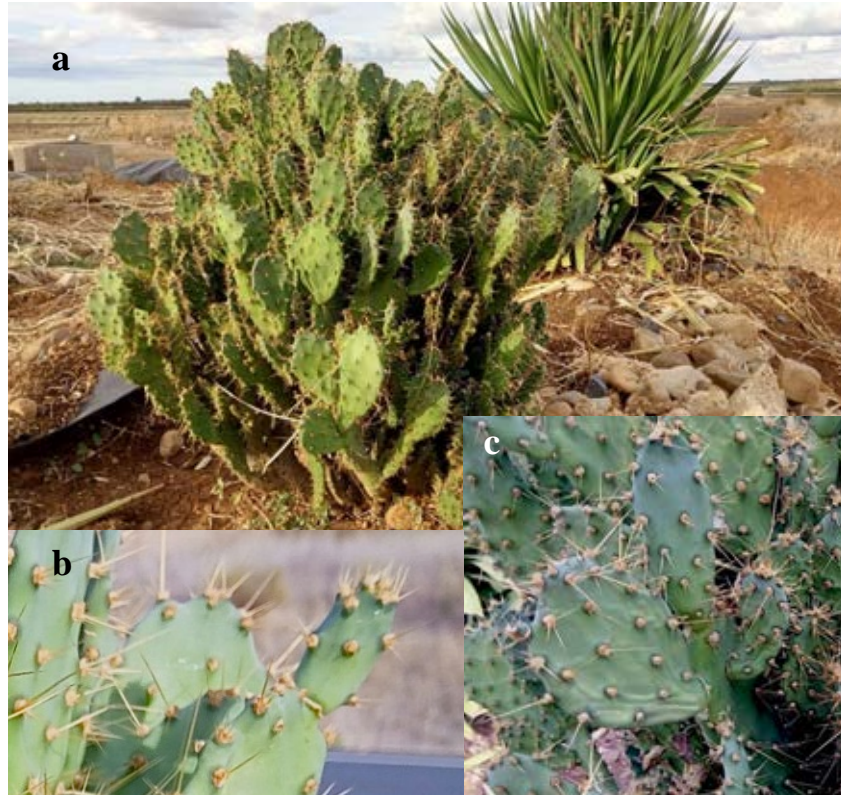
Lámina 7b.- Opuntia tuna (L.) Mill. a) Porte general de la planta; b) Aspecto de un fruto en desarrollo; c) Aspecto de varios cladodios. Origen: Hs: Badajoz (Ba): Montijo.