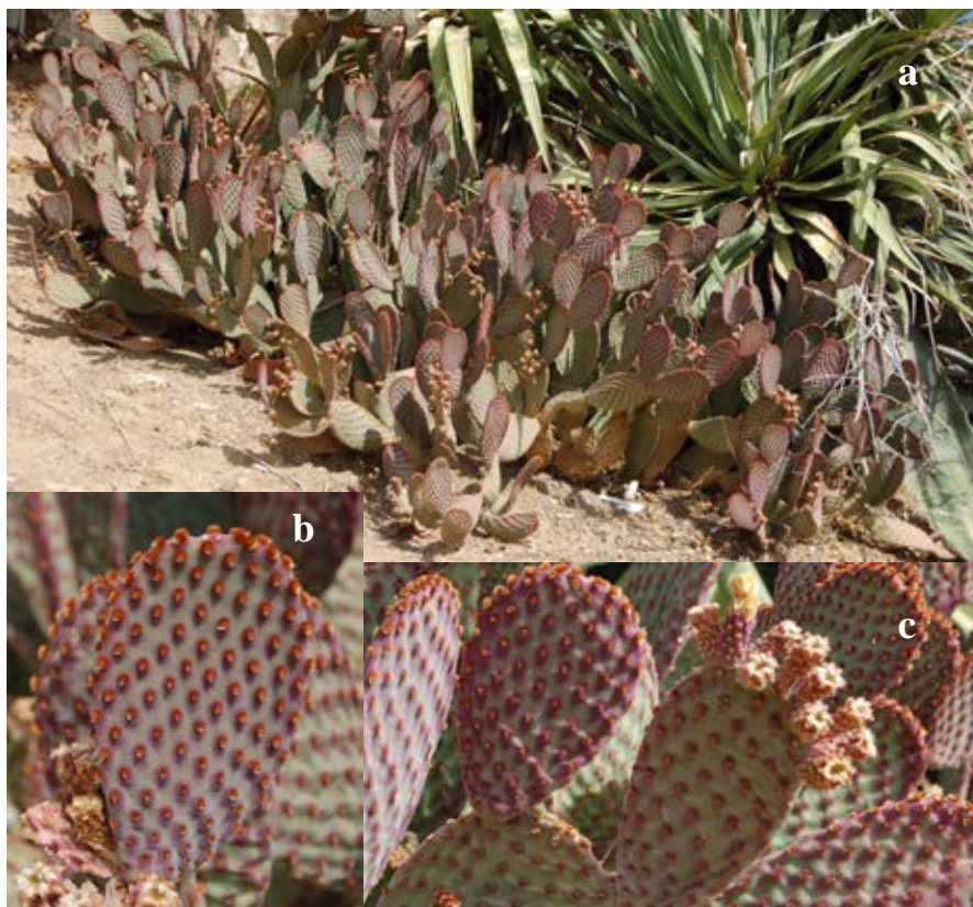
Lámina 6b.- Opuntia rufida Engelm. a) Porte general de la planta; b) Aspecto de un cladodido; c) Aspecto de un cladodido con flores tras la antesis. Origen: Hs: Badajoz (Ba): Lobón.