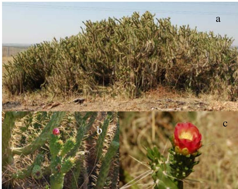
Lámina 1a.- Austrocyllindropuntia exaltata (A. Berger) Backeb. a) Porte general de la planta; b) Aspecto de un grupo de cladodios; c) Aspecto de una flor. Origen: Hs: Badajoz (Ba): Mérida.