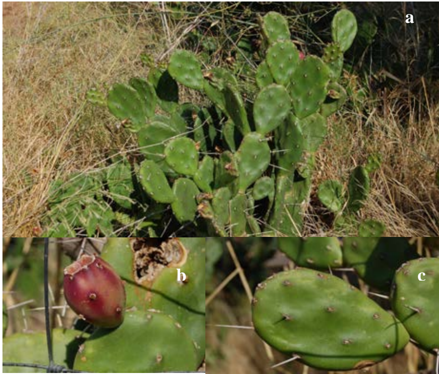
Lámina 5a.- Opuntia humifusa (Raf.) Raf. a) Porte general de la planta; b) Aspecto del fruto; c) Aspecto de un cladodido o pala. Origen: Hs: Badajoz (Ba): Mérida.