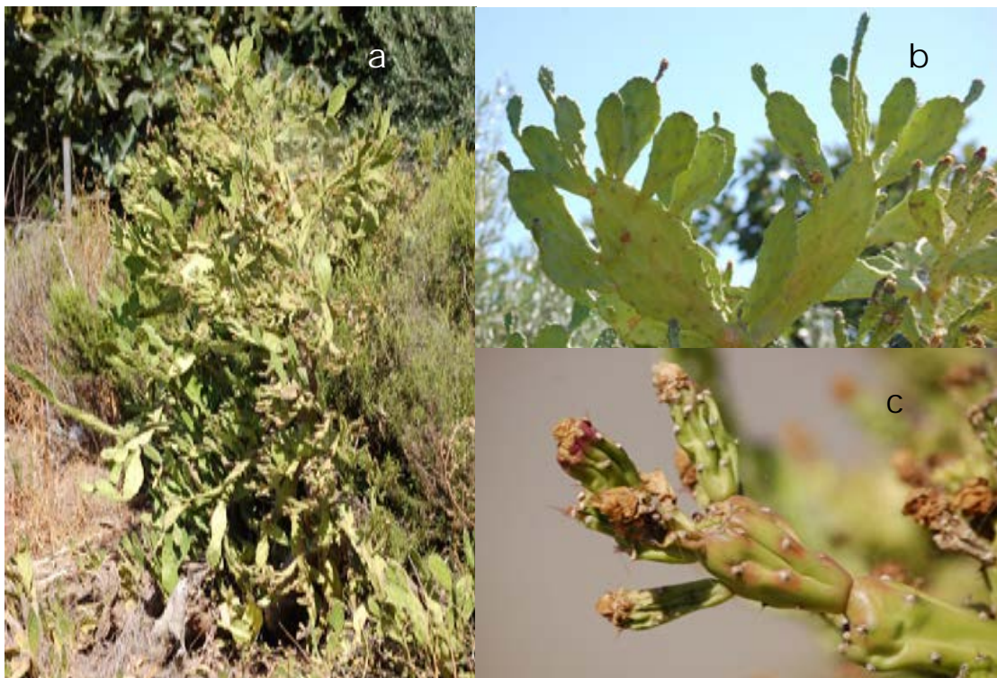
Lámina 2b.- Opuntia monacantha (Willd.) Haw. a) Porte general de la planta; b) Aspecto de un grupo de cladodios; c) Aspecto de un fruto con flores pasadas. Origen: Hs: Badajoz (Ba): Montijo.