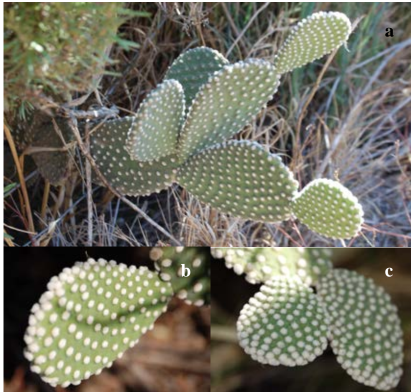
Lámina 6a.- Opuntia microdasys (Lehm.) Lehm. ex Pfeiff. var. albispina Fobe a) Porte general de la planta; b) Aspecto de un cladodido; c) Aspecto de dos cladodidos jóvenes. Origen: Hs: Badajoz (Ba): Montijo.