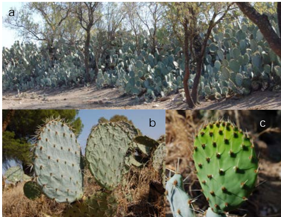
Lámina 3a.- Opuntia engelmannii Salm-Dyck ex Engelm. a) Porte general de la planta; b) Aspecto de un par de cladodios; c) Aspecto de un cladodido joven con hojas. Origen: Hs: Badajoz (Ba):Almendralejo.