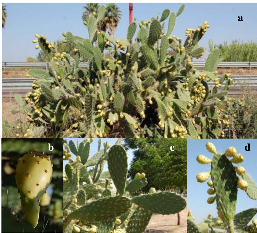
Lámina 4b.- Opuntia maxima Mill. a) Porte general de la planta; b) Aspecto del fruto; c) Aspecto de un cladodido o pala; d) Aspecto de un cladodido portando frutos. Origen: Hs: Badajoz (Ba):Mérida.