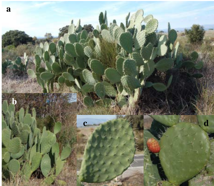
Lámina 7a.- Opuntia ficus-indica (L.) Mill. (= Opuntia megacantha Salm-Dyck). a) Porte general de la planta; b) Contraste entre un ejemplar afilo (dcha.) y uno espinescente (izqda.); c) Aspecto de un cladodio; d) Aspecto de un fruto sobre el cladodio. Origen: Hs: Cáceres (Cc): Navalmoral de la Mata.