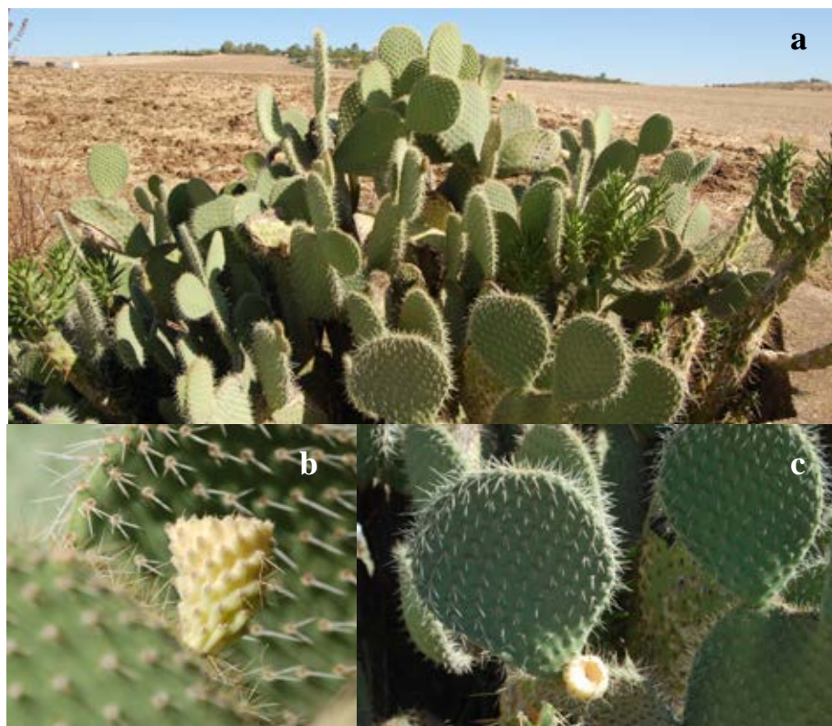
Lámina 3b.- Opuntia leucotricha DC. a) Porte general de la planta; b) Aspecto del fruto; c) Aspecto de un cladodido o pala. Origen: Hs: Badajoz (Ba):Montijo.