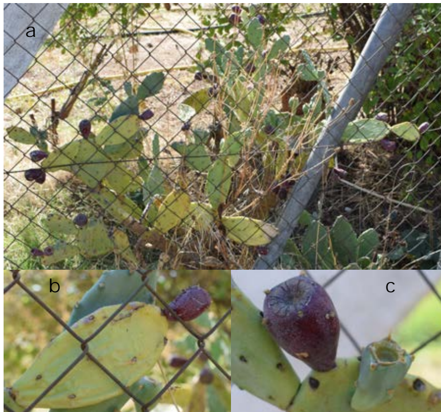
Lámina 5b.- Opuntia stricta (Haw.) Haw. a) Porte general de la planta; b) Aspecto de un cladodio con fruto; c) Aspecto de un fruto joven y otro maduro. Origen: Hs: Badajoz (Ba): Badajoz.