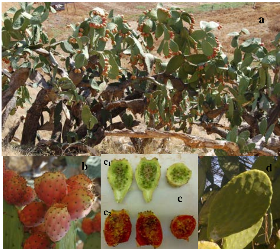
Lámina 4a.- Opuntia ficus-indica (L.) Mill. a) Porte general de la planta; b) Aspecto del fruto; c) Aspecto la sección del fruto de O. ficus-indica (c 2 ) frente a la sección del fruto de O. maxima (c 1 ); d) Aspecto de un cladodido o pala. Origen: Hs: Badajoz (Ba): Lóbón.