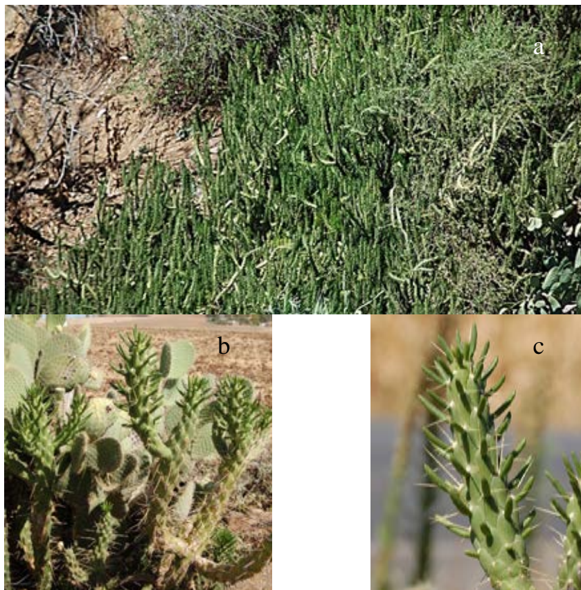
Lámina 1b.- Austrocyllindropuntia subulata (Muehlenpf.) Backeb. a) Porte general de la planta; b) Aspecto de un grupo de cladodios; c) Aspecto de un cladodio. Origen: Hs: Badajoz (Ba): Lobón (a) y Montijo (b, c).