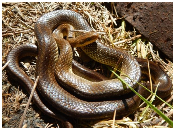
Adulte Très grande couleuvre d'aspect brillant vert olive à marron au ventre jaune immaculé Dessus du corps souvent constellé de points blancs