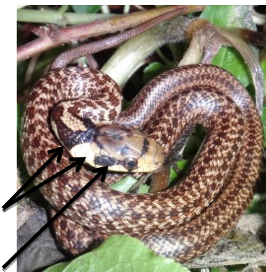
Jeune Dos tacheté de clair sur fond brun-gris ou gris-vert 1 petite bande noire derrière l'œil Collier jaune délimité par une tache brune en U inversé derrière la nuque

Défense : généralement placide, elle s'éloigne discrètement mais cherche parfois à mordre si elle est acculée . Peut aussi émettre un produit malodorant