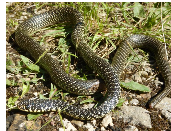
Adulte : grand serpent d'aspect vert sombre tacheté de jaune clair Corps noir ou vert foncé avec des taches pâles formant des barres transversales sur l'avant du corps et des lignes longitudinales sur la partie postérieure et la queue