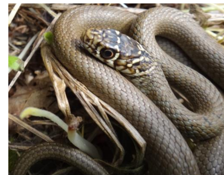
Jeune Seule la tête noire à dessins clairs rappelle l'adulte Dos gris-olivâtre et ventre blanc jaunâtre

Défense : acculée, fait souvent face à son agresseur et peut essayer de mordre avant de fuir rapidement si elle est inquiétée