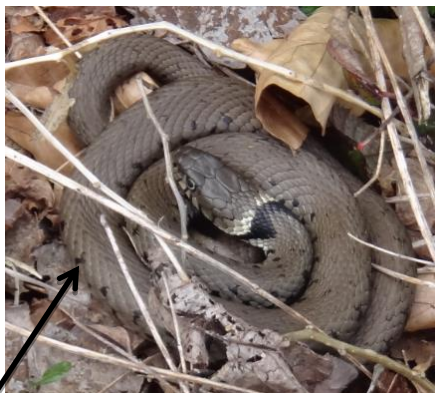
Serpent gris à brun avec un collier noir / blanc distinctif +/- visible sur le cou

Jeunes : répliques miniatures des adultes