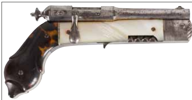
Détail du lot 34