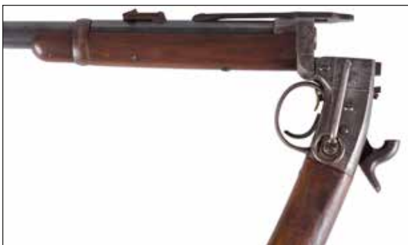
Détail du lot 117