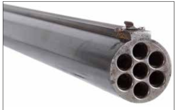
Détail du lot 71