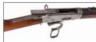
Détail du lot 155