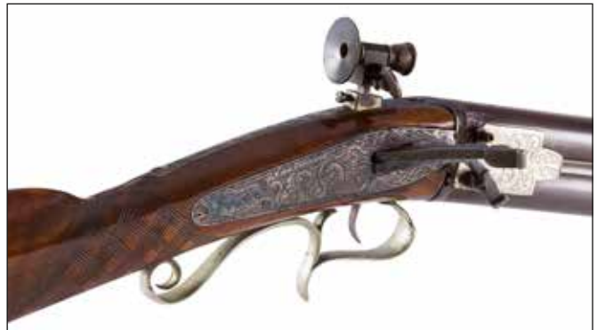
Détail du lot 108