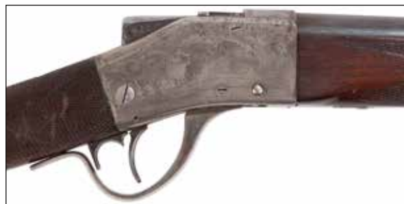
Détail du lot 128