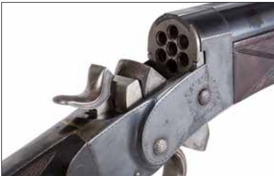
Détail du lot 71