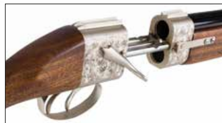
Détail du lot 166