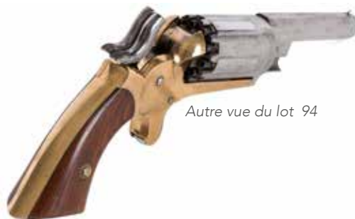
Autre vue du lot 94