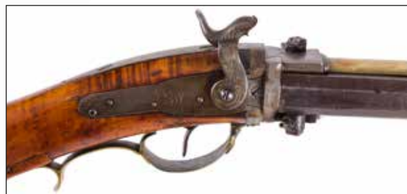
Détail du lot 107