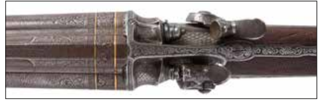
Détail du lot 76