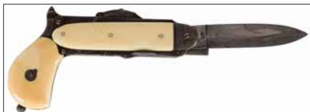
Détail du lot 52