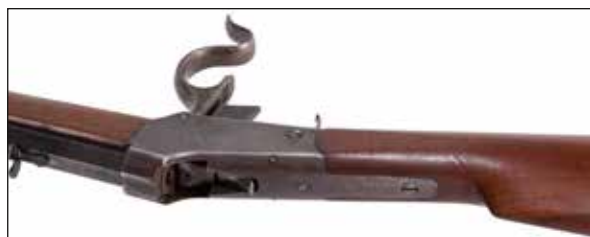
Détail du lot 136