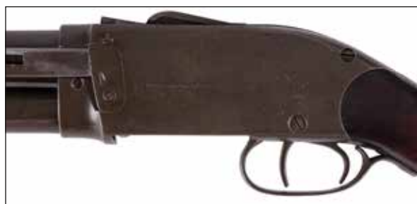
Détail du lot 135