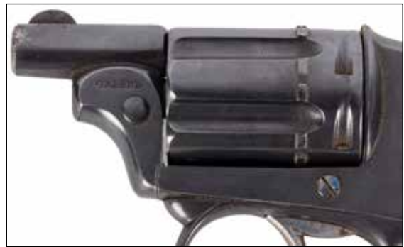
Détail du lot 44

44 REVOLVER GALAND TYPE BULLDOG, 6 COUPS, CALIBRE 6 MM, DOUBLE ACTION. Court canon rond rayé de 3 cm. Barillet évidé. Plaquettes de crosse en ébène quadrillé. Frappé sous le canon Galand et « Velo-dog ». Longueur totale: 11,5 cm Finition bleuie. T.B.E. Vers 1880-1900. Dans son étui type porte-monnaie en peau (trou).