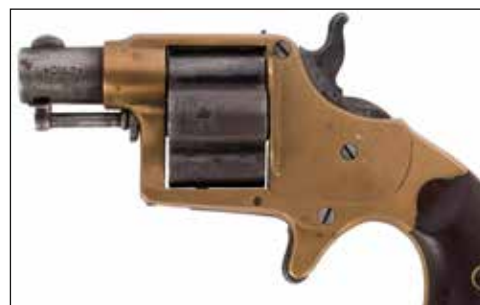
Détail du lot 101