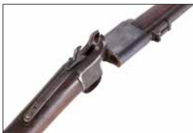
Détail du lot 121