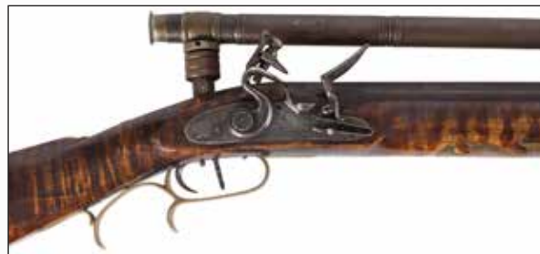
Détail du lot 106