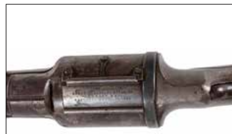
Détail du lot 124