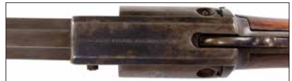
Détail du lot 113