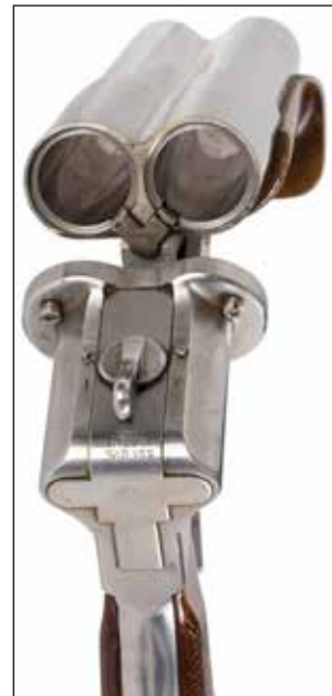
Détail du lot 57