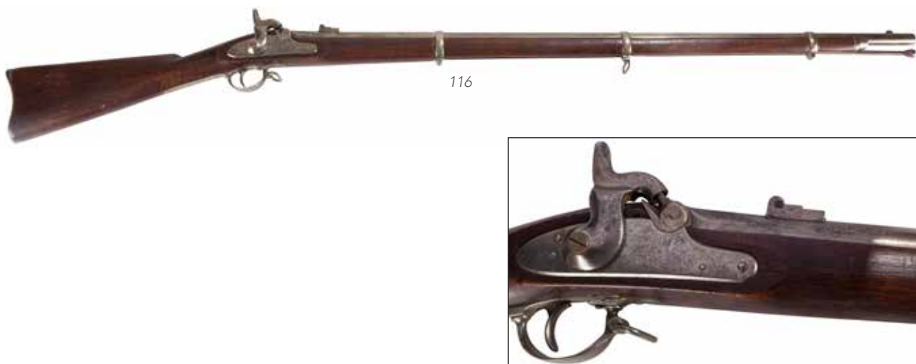
Détail du lot 116