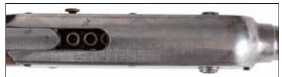
Détail du lot 77

Paulin GAY, ingénieur civil est l'inventeur d'armes à coups multiple, dites mitrailleuses de poche, revolvers et carabines à 25, 40, 50 et 100 coups (1879)