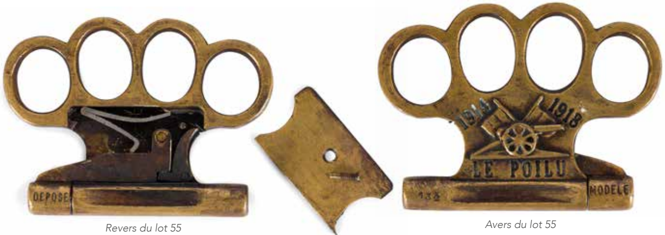
Revers du lot 55