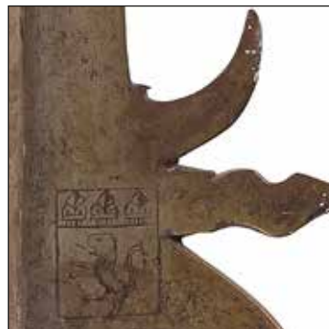
Détail du lot 13