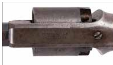
Détail du lot 93