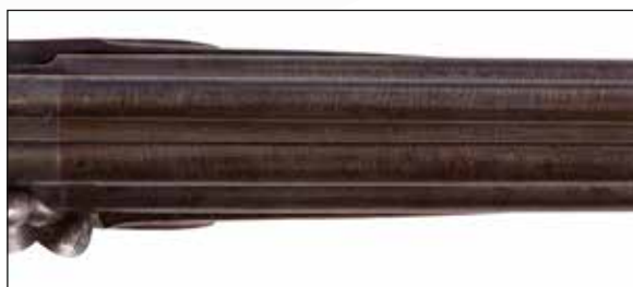
Détail du lot 66