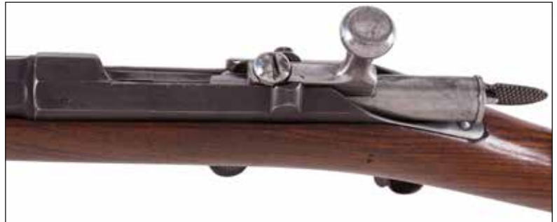
Détail du lot 81