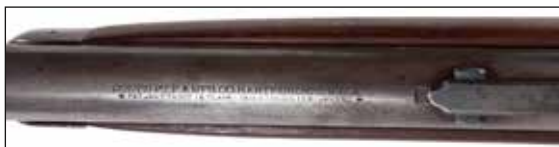
Détail du lot 132