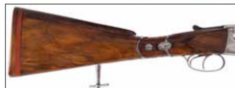
Détail du lot 167