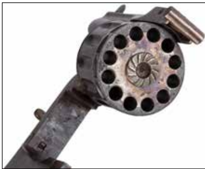
Détail du lot 43

43 REVOLVER TYPE BULLDOG, 12 COUPS, CALIBRE 5,5 MM À PERCUSSION CENTRALE. Canon rond rayé avec bande sur le dessus marquée « Manufre d'armes St Etienne ». Ouverture à basculement vers le bas. Barillet évidé à extracteur collectif. Détente pliante. Plaquettes de crosse en ébène quadrillé. Dans un étui type porte-monnaie en peau. Frappé 8749. Finition rebronzée. Longueur: 14 cm A.B.E. Vers 1880.