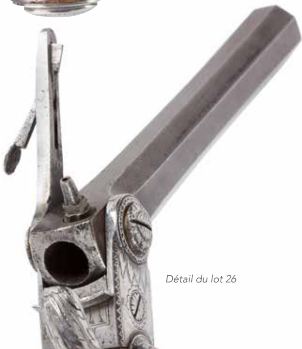
Détail du lot 26