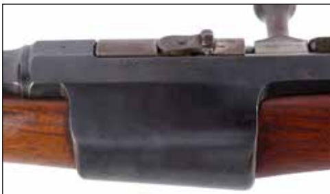
Détail du lot 80