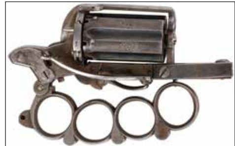
Détail du lot 35