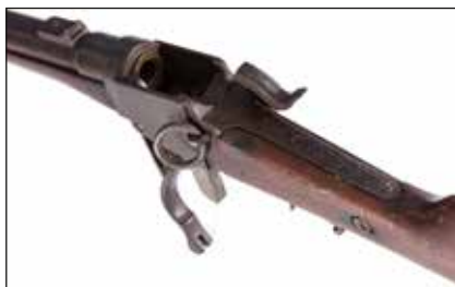
Détail du lot 122