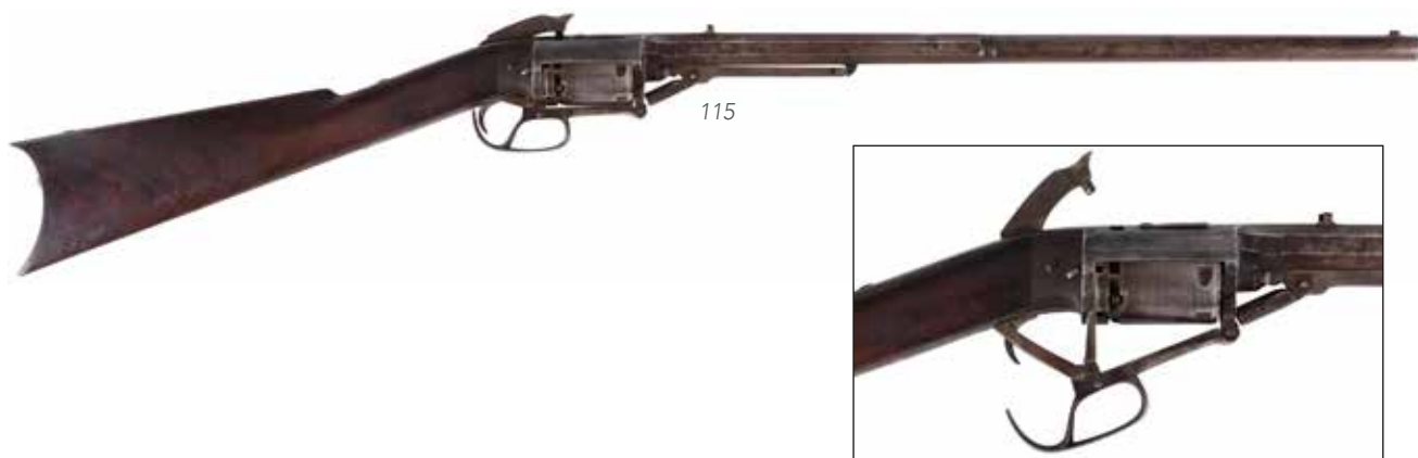
Détail du lot 115