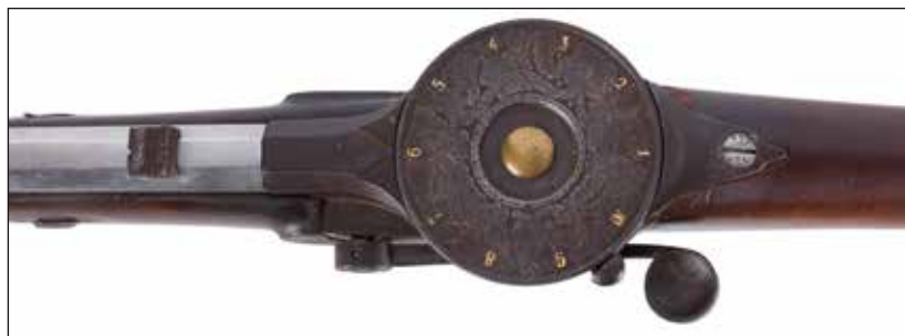
Détail du lot 69