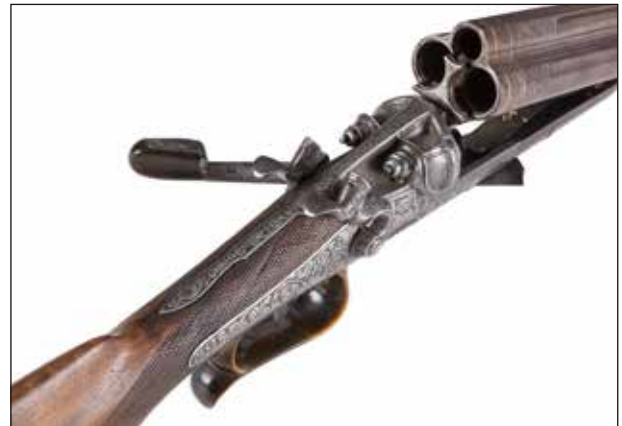
Détail du lot 76