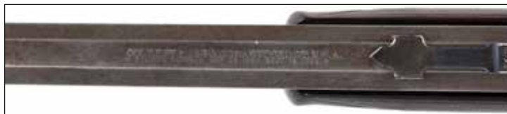
Détail du lot 133