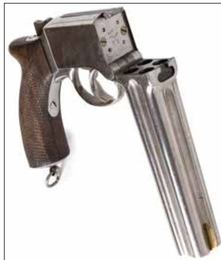
Détail du lot 149