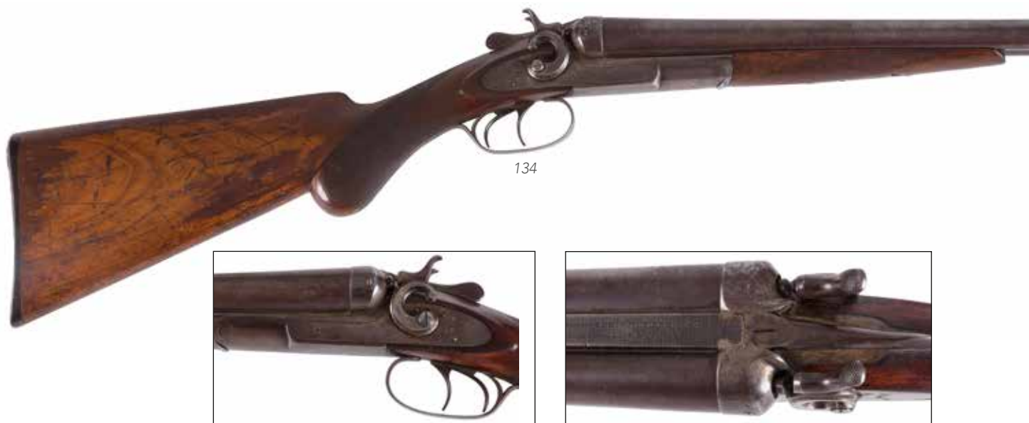
Détail du lot 134