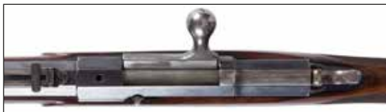
Détail du lot 131