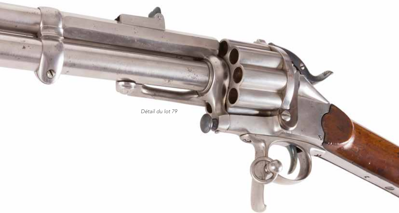
Détail du lot 79