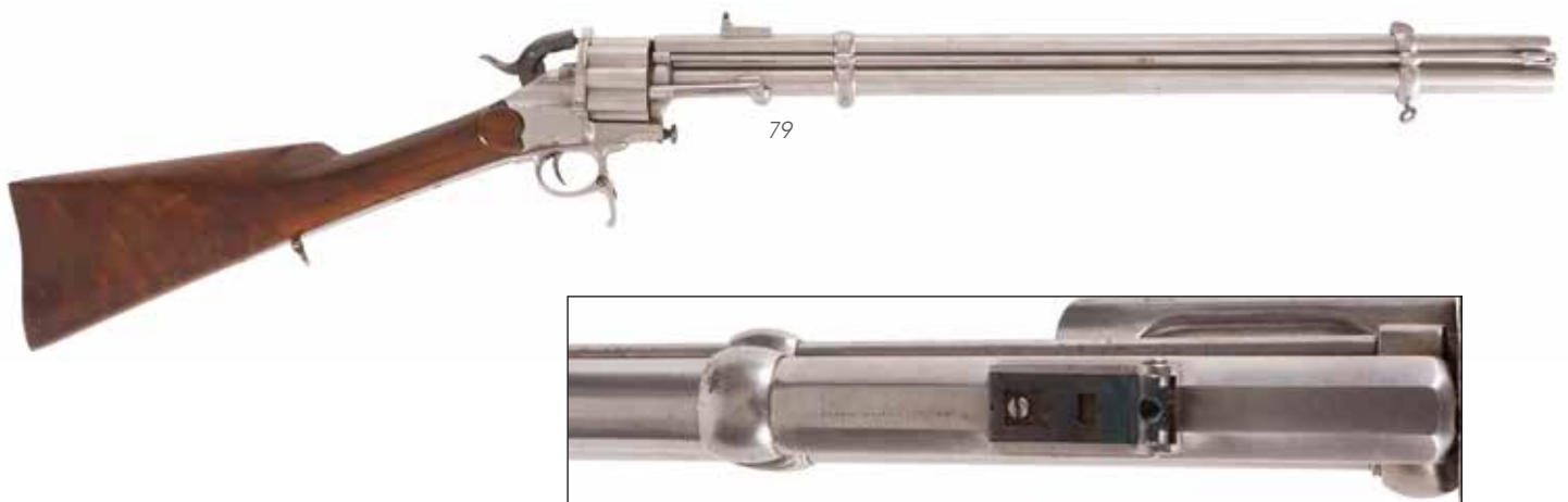
Détail du lot 79