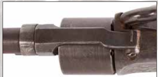
Détail du lot 88