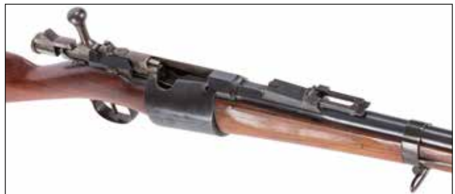
Détail du lot 80