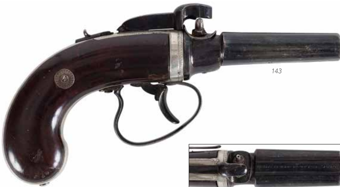
Détail du lot 143

Bloc de deux canons ronds en table se présentant sous le chien d'un quart de tour, marqué sur la bande «Westley Richards 170 new Bond St London.» Chien sans crête. Sécurité à l'arrière du chien. Monture en argent gravé de rinceaux. Crochet de ceinture sur le côté gauche. Plaquettes de crosse en noyer foncé verni. Longueur: 18 cm B.E. Remis en couleurs. Vers 1850. 500/600€