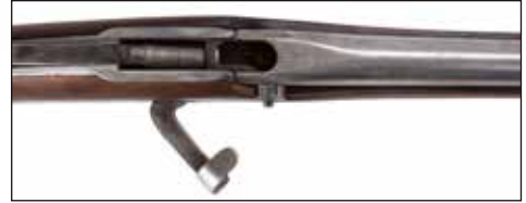
Détail du lot 112