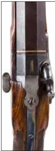
Détail du lot 63