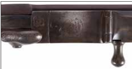
Détail du lot 148

Fabriquée de 1855 à 1857 à 2000 exemplaires. 1 500/1 800€