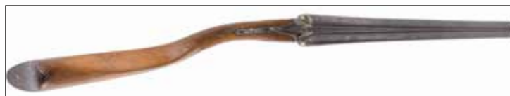
Détail du lot 168