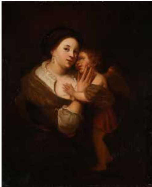
94 - École HOLLANDAISE du XVIIIème siècle, suiveur de REMBRANDT Portrait de femme enlaçant un putto Toile 43,5 x 37 cm