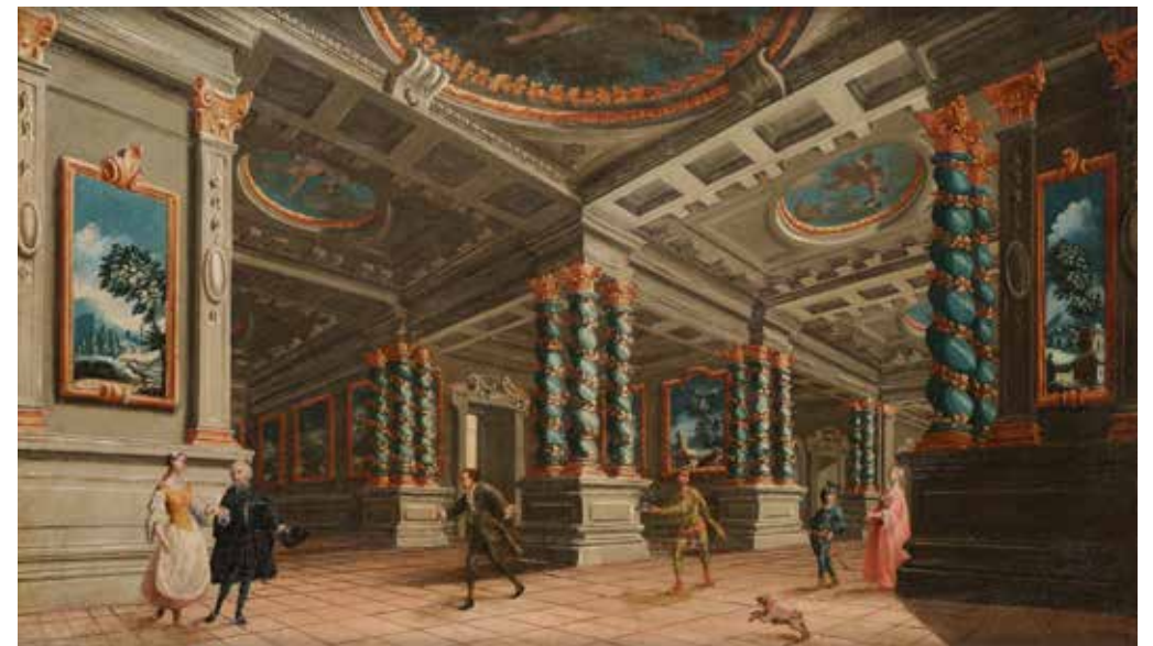
5 - École VENITIENNE du XVIIIème siècle Intérieur d'un palais italien Toile 68 x 117 cm