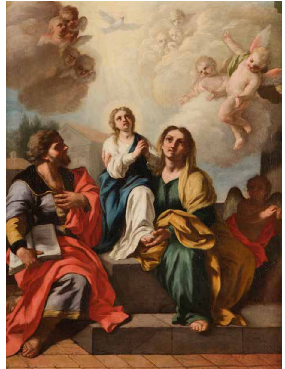
96 - Attribué à Francesco SOLIMENA (Serino 1657 - Naples 1747) Sainte Famille