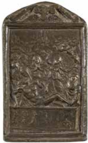
118 - Baiser de paix en étain à décor en relief de la Mise au tombeau. XVIIème siècle. H : 12 - L : 7 cm Usures, poignée déformée au revers