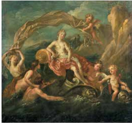
2 - École FRANÇAISE de la fin du XVIIIème siècle Venus sortie des eaux Toile 81 x 88 cm Sans cadre