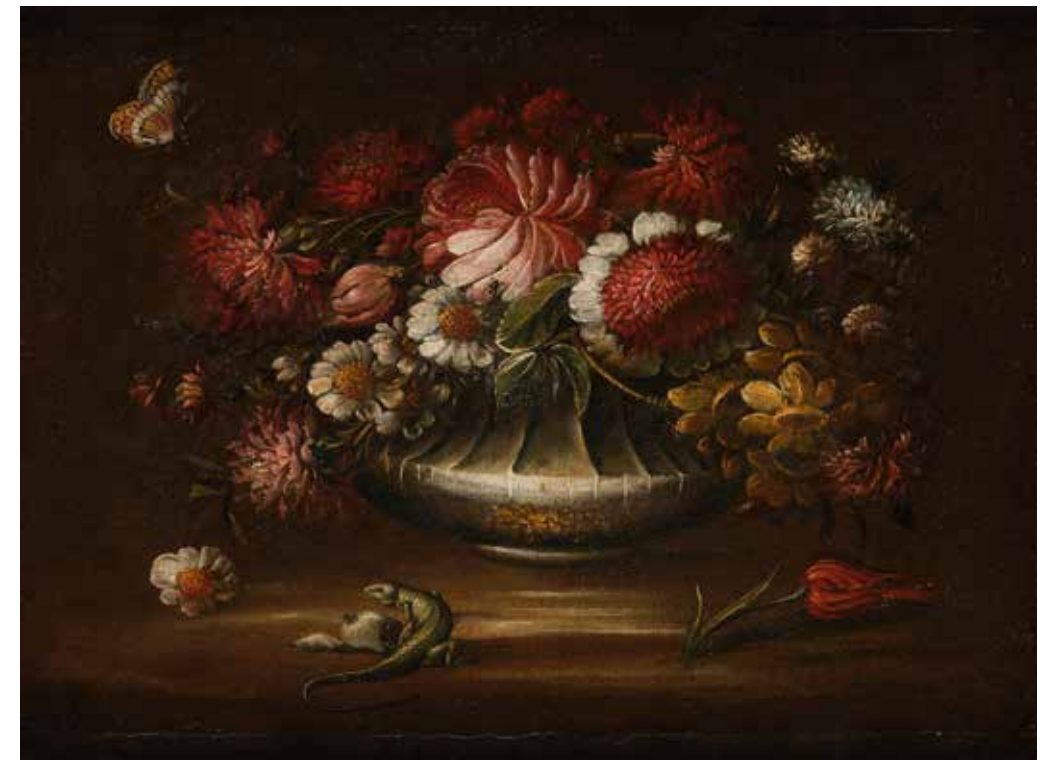
66 - École ITALIENNE du XVIIème siècle, Attribué à Paolo PORPORA Nature morte au bouquet de fleurs et lézard Toile 52 x 38 cm 4 000/6 000 €