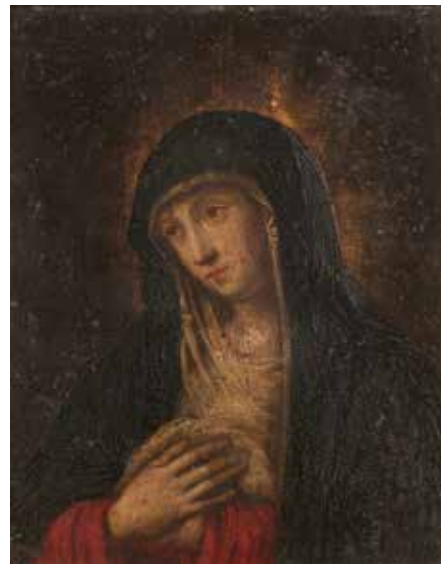
45 - École FLAMANDE vers 1640 Vierge en prière Cuivre 17 x 13 cm