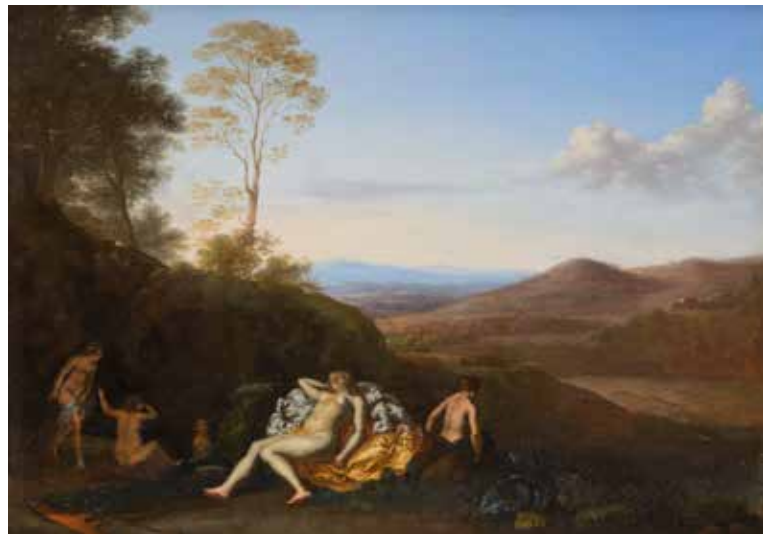
4 - École BOLOGNAISE du XVIIème siècle, suiveur de Lucio MASSARI La Piscine de Béthesda Toile 44 x 62 cm D'après le tableau du musée du Capitole de Rome.