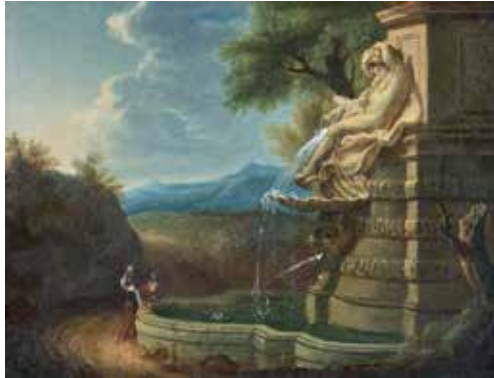
6 - École FRANÇAISE du XVIIIème siècle Deux paysans au bord d'une fontaine antiquisante Toile 24 x 33 cm 600/800 €