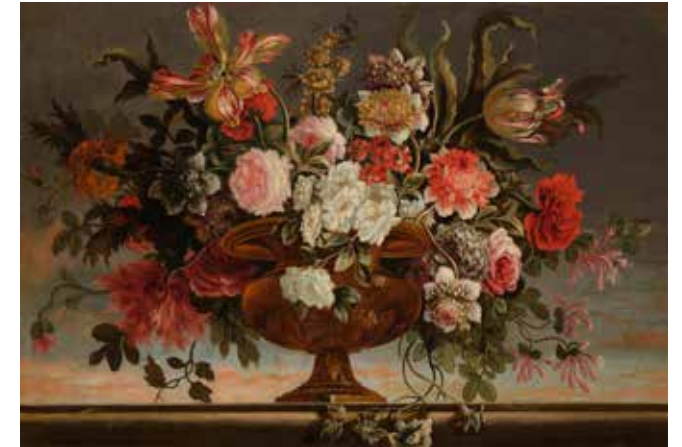
65 - École FRANÇAISE vers 1800, dans le gout de Pierre-Nicolas HULLIOT Vase de fleurs devant une fenêtre Toile 67 x 87 cm Sans cadre 1 200/1 500 €