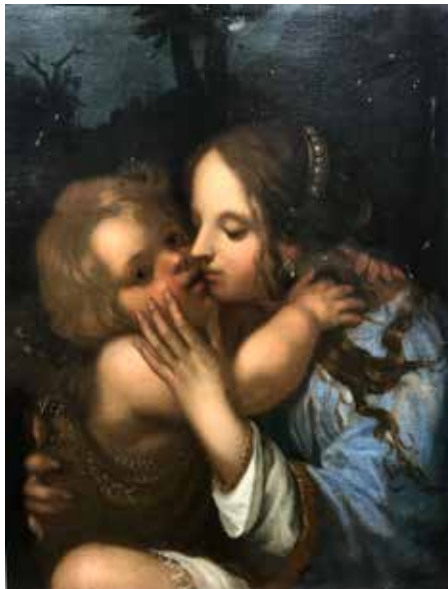
42 - École LOMBARDE du XVIIème siècle Vierge à l'enfant Restaurations 66 x 51 cm