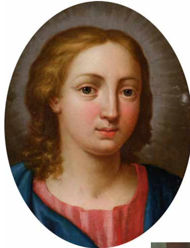
46 - École ITALIENNE du XVIIème siècle, entourage à Giovanni Battista SALVI dit «SASSOFERRATO» Christ enfant Cuivre ovale 22,5 x 15,5 cm