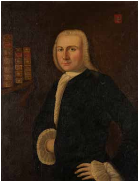
80 - École FRANCAISE du XVIIIème siècle Portrait d'homme aux livres Toile 78 x 63 cm