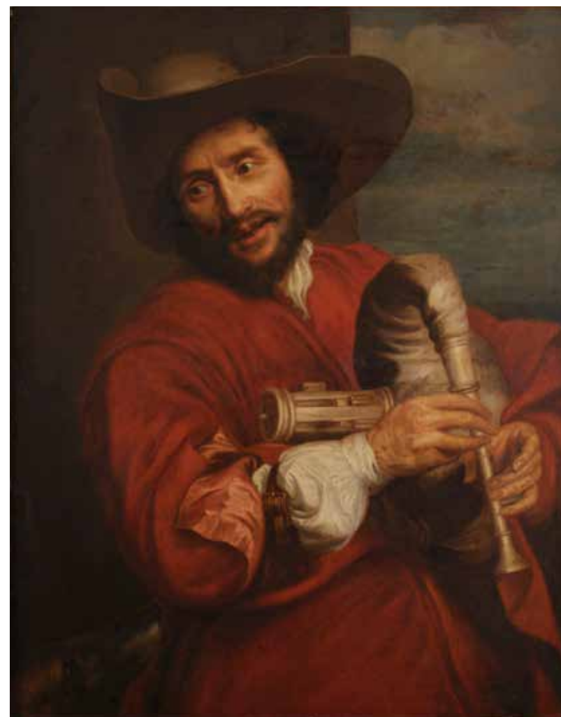
Atelier d'Antoine Van DYCK, Portrait de François Langlois en Savoyard , Toile

Mars 2022 — Hôtel Drouot, Paris Vente en préparation