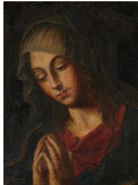
43 - École ITALIENNE du XVIIème siècle La Vierge en prière Toile 38 x 29 cm Porte un monogramme et une date en bas à gauche C.D. 1643