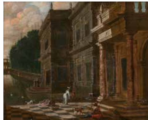
8 - École ROMAINE du XVIIème siècle Le temple de Portunus à Rome Panneau 17 x 22,5 600/800 €