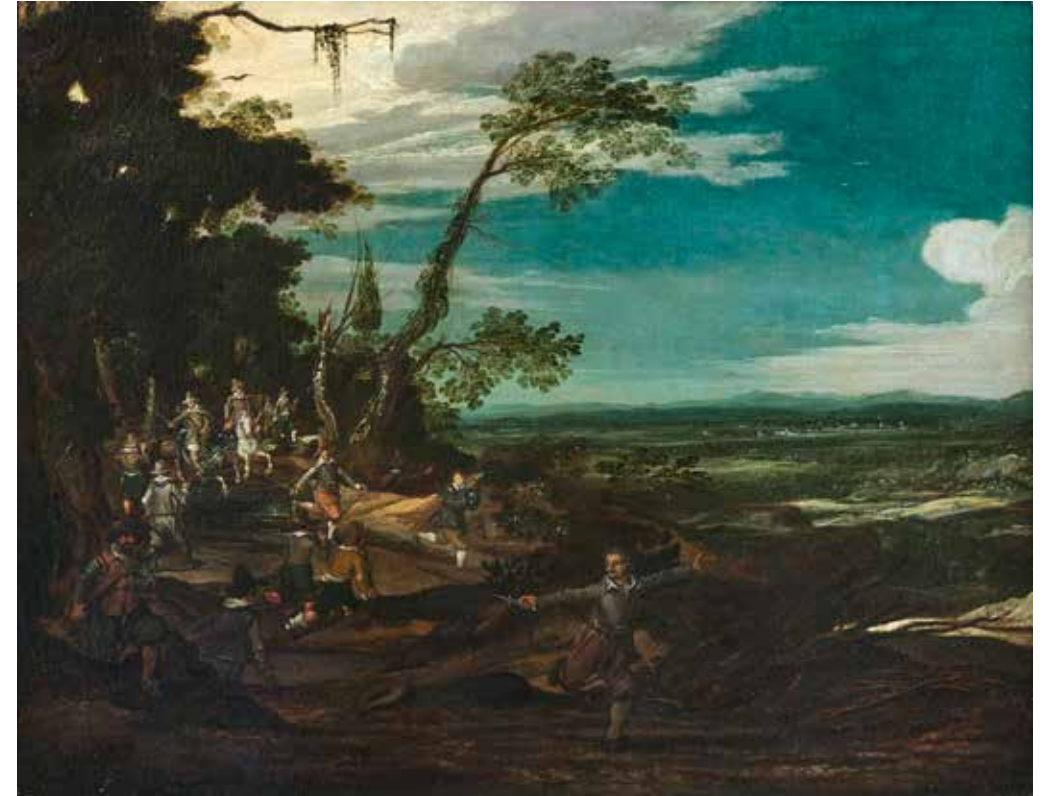
10 - École FLAMANDE du XVIIème siècle, entourage de Sébastien VRANCX L'embuscade dans les bois Toile 73 x 55 cm Restaurations