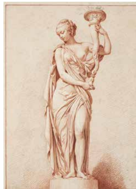
Augustin Pajou, Torchère, Sanguine