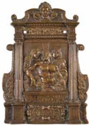
119 - Baiser de paix orné de la Mise au tombeau entre la Vierge et saint Jean dans un encadrement en forme de tabernacle architecturé, flanqué de deux colonnes et d'accolades, l'ensemble surmonté d'un fronton centré d'une tête d'angelot. Cartouche inscrit dans le stylobate et portant l'inscription «Pietas Adomnia». Bronze doré. Italie, XVIIème siècle H : 16 - L : 11 cm Usures, sans poignée