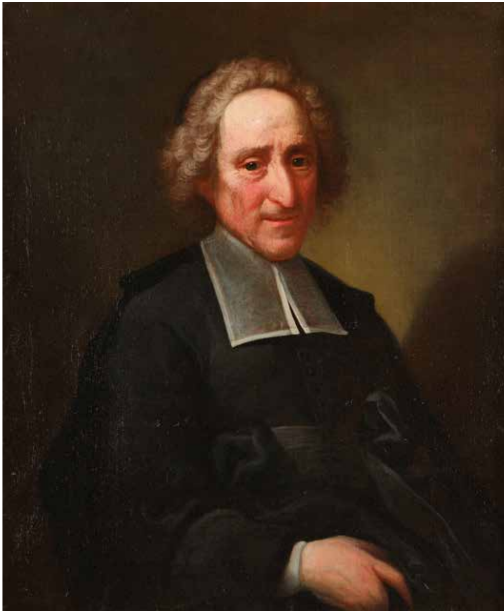
77 - Giacomo CERUTI (Milan 1698-1767) Portrait d'un ecclésiastique Toile 73 x 60 cm 4 000/6 000 €