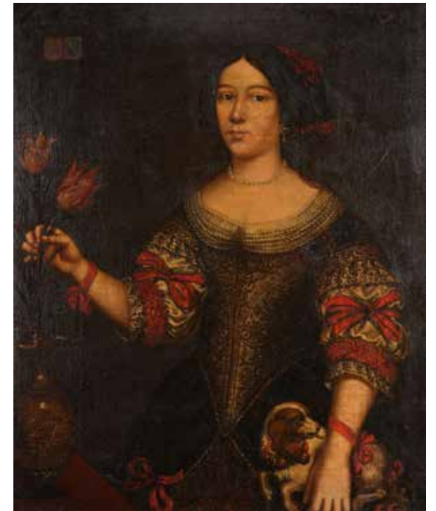
78 - Attribué à Jakob Ferdinand VOET (Anvers 1639 - Paris 1689) Portrait de femme Portrait d'homme Paire de toiles 84 x 66 cm 5 000/6 000 €