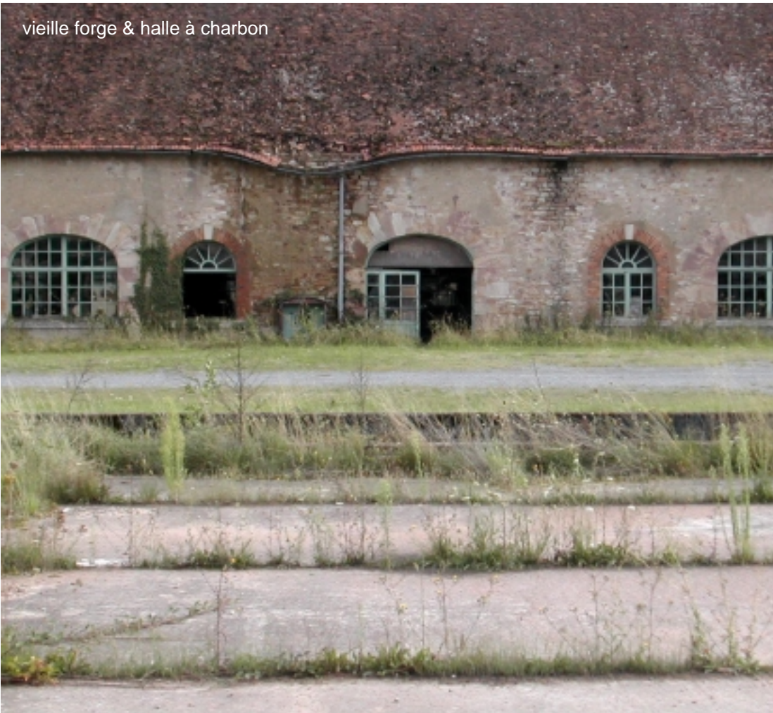
vieille forge & halle à charbon