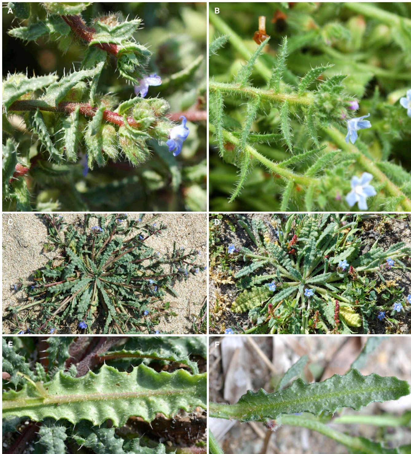
Fig. 2. – A. Anchusa crisper subsp. valincoana Paradis, Piazza & Quilichini: tiges florifères; B. Anchusa crisper Viv. subsp. crisper : tiges florifères; C. Anchusa crisper subsp. valincoana : individus fleuris; D. Anchusa crisper subsp. crisper : individus fleuris; E. Anchusa crisper subsp. valincoana : face inférieure d'une feuille; F. Anchusa crisper subsp. crisper : face inférieure d'une feuille.