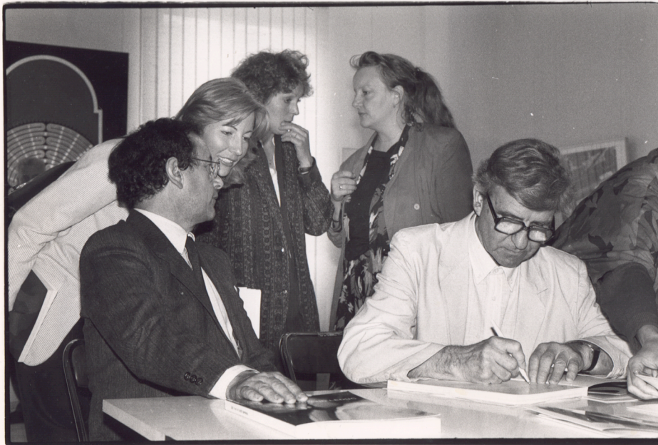
Fernand Leduc dédicant le catalogue de l'exposition « Fernand Leduc de 1943 à 1985 », au Musée des beaux-arts de Chartres, le 22 juin 1985. De gauche à droite : le maire de Chartres, son assistante, Maïthé Vales-Bled, Sylvie de La Salle.

[Photo noir et blanc, 7 X 9 1/2 ].