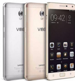
Vibe P1 LNV-PA1N0115TH (Grey) LNV-PA1N0111TH (Gold)