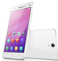
Vibe S1 LNV-PA200016TH (White) LNV-PA200030TH (Blue) LNV-PA200062T H (Gold)