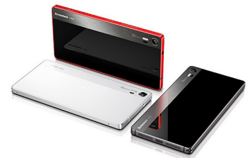
Vibe Shot LNV-PA1K0015TH (Grey) LNV-PA1K0084TH (White)