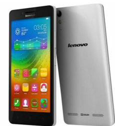
A6000 (16G) LNV-POSB004WTH (Black) LNV-POSB0057TH (White)