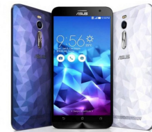
Zenfone Deluxe ZE551ML ASU-Z00AD-2A799WW (Purple)

Free!! MicroSD Card 16GB + ZenFlash + Flip case