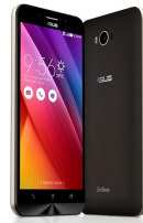
Zenfone Max - ZC550KL ASU-Z010D-6A019WW (Black) ASU-Z010D-6B043WW (White)

Free!! MicroSD Card 16GB + ZenFlash + Flip case