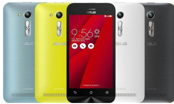
Zenfone GO 4.5" - ZB452KG ASU-X014D-6G043WW (Gold) ASU-X014D-6J044WW (Silver) ASU-X014D-6K045WW (Blue)