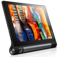
Tab3 X70L LNV-ZA0Y0014TH