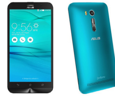
Zenfone GO 5.5" DTV - ZB551KL ASU-X013DA-3G104TH (Gold) ASU-X013DA-3H105TH (Silver) ASU-X013DA-3K106TH (Blue)