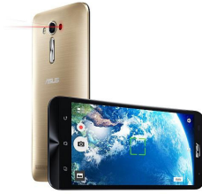
Zenfone 2 Laser SE - ZE550KL ASU-Z00LD-6G230WW (Gold) ASU-Z00LD-6J231WW (Silver)