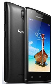
A1000 LNV-PA1R0013TH (Black) LNV-PA1R0035TH (White)