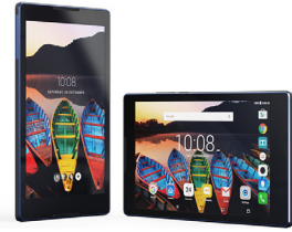
Tab3 850 LNV-ZA180023TH (Ebony Black) LNV-ZA180044TH (Pearl White)