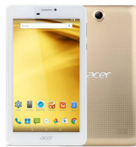
ICONIA B1-723 ACR-NTLBSST001 (Gold)