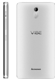
Vibe X3 LNV-PA280010TH (White)