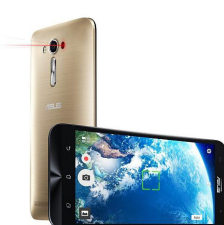
Zenfone 2 Laser SE - ZE550KL ASU-Z00LD-6G230WW (Gold) ASU-Z00LD-6J231WW (Silver)