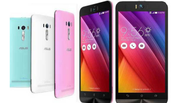
Zenfone 2 Selfie - ZD551KL ASU-Z00UD-6G402WW (Gold) ASU-Z00UD-6J401WW (Silver)