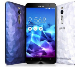
Zenfone Deluxe - ZE551ML ASU-Z00AD-2A799WW (Purple)