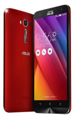
Zenfone 2 Laser 5.5" - ZE550KL ASU-Z00LD-6G137WW (Gold) ASU-Z00LD-6J138WW (Silver)