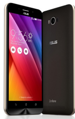
Zenfone Max - ZC550KL ASU-Z010D-6A019WW (Black) ASU-Z010D-6B043WW (White)