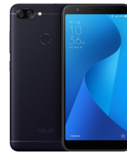
ZenFone Max Plus (M1) ZB570TL

ASU-X00RD-4A036TH (Black) ASU-X00RD-4G037TH (Gold)