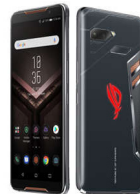
ROG Phone ZS600KL