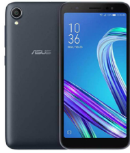
Zenfone Live L1 ZA550KL

ASU-X00RD-4A036TH (Black) ASU-X00RD-4G037TH (Gold)