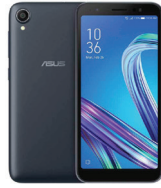
Zenfone Live L1 ZA550KL