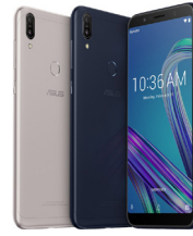
ZenFone Max Pro M1 (6GB / 64GB)

ASU-X00TD-4A089TH (Black) ASU-X00TD-4H090TH (Silver)