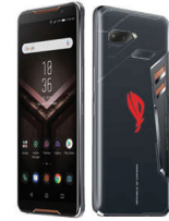
ROG Phone ZS600KL