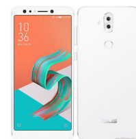
Zenfone 5Q ZC600KL