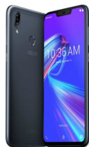
Zenfone Max M2 (ZB633KL) (4GB / 64GB)

ASU-X01AD-4A078G1 (Midnight Blue) ASU-X01AD-4J080G1 (Metro Silver)