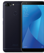
ZenFone Max Plus (M1) ZB570TL

ASU-X018D-4A082TH (Black) ASU-X018D-4G083TH (Gold)