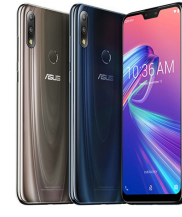
Zenfone Max Pro M2 (6GB / 64GB)

ASU-X00TD-4A092TH (Black) ASU-X00TD-4H091TH (Silver)