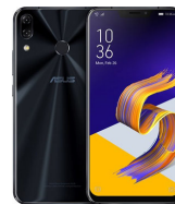
ZenFone 5 ZE620KL

ASU-X01AD-4A078G1 (Midnight Blue) ASU-X01AD-4J080G1 (Metro Silver)