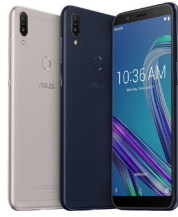
ZenFone Max Pro M1 (4GB / 64GB)

ASU-X00TD-4A089TH (Black) ASU-X00TD-4H090TH (Silver)