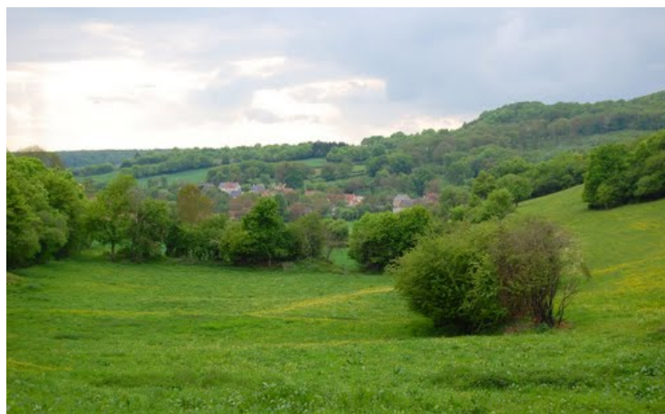
Paysage des Amognes (Nièvre)