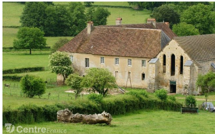
l'abbaye Notre-Dame et Saint-Paul de Bellevaux (Limanton)