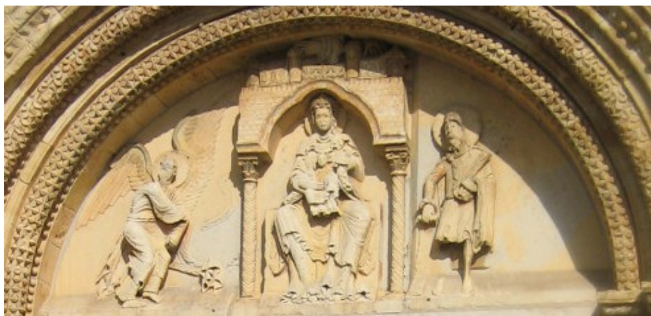
Tympans de Donzy-le-Pré – Sceau de Mahaut de Courtenay