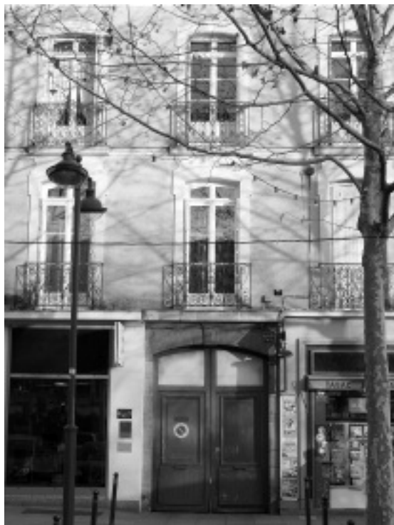
Le Planning au 9, place Bretagne