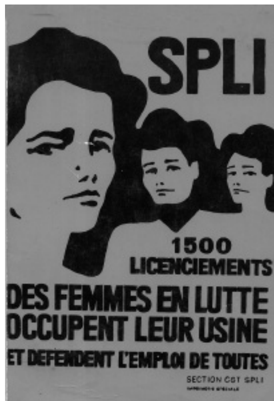
Affiche de 1977

La SPLI, Société Parisienne de Lingerie Indémaillable a été créée avant la Première Guerre Mondiale. Elle s'installe à Rennes en 1967. La main d'oeuvre y est essentiellement féminine et fabrique des maillots de bain. Face à la menace de licenciement de l'ensemble du personnel, soit 1 500 personnes au total, les ouvrières vont tenter de sauvegarder les emplois. Elles occupent l'usine à partir de juin 1978.