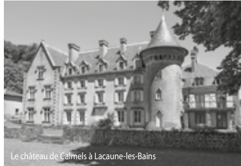
Le château de Calmels à Lacaune-les-Bains

> Rieumontagné - ☎ : De 18h à 23h - ☎ : Comité d'animation Nages-Laouzans - ☎ : 06 89 69 75 25