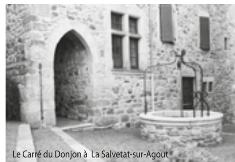
Le Carré du Donjon à La Salvetat-sur-Agoût

> Galerie d'art Frezouls - Pour toute la famille (enfants à partir de 7 ans) - ☎ : De 14h à 18h - ☎ : Gratuit - Entrée sur inscription (places limitées) : 05 32 11 09 45 - contact@tourismemhl.fr - ☎ : Communauté de Communes des Monts de Lacaune et de la Montagne du Haut Languedoc et Mairie de Lacaune - ☎ : 05 32 11 09 45