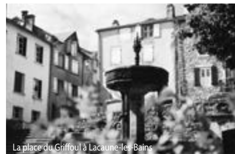
La place du Griffoul à Lacaune-les-Bains