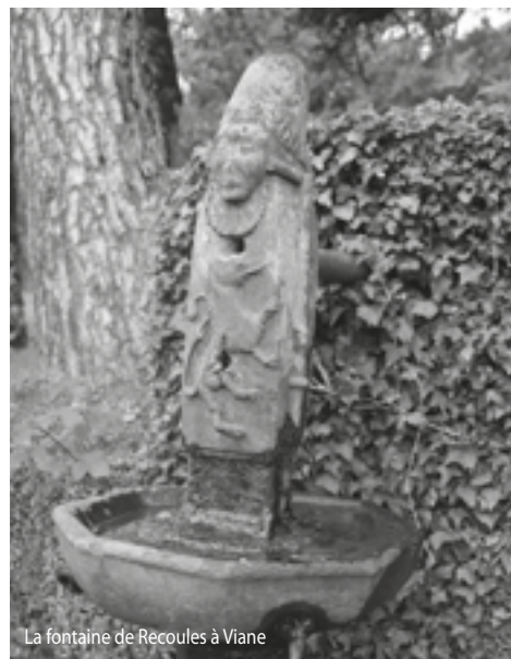
La fontaine de Recoules à Viane

> Tours du Château - ☎ : De 17h30 à 19h30