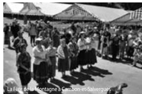
La Fête de la Montagne à Cambon-et-Salvergues