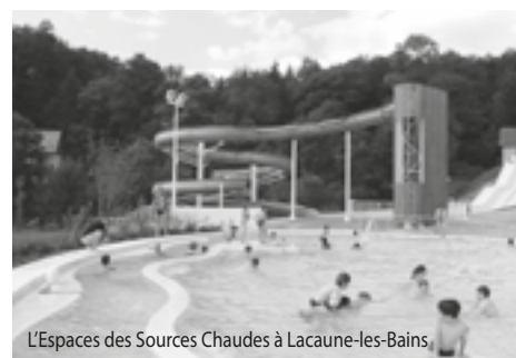
L'Espaces des Sources Chaudes à Lacaune-les-Bains