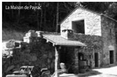
La Maison de Payrac