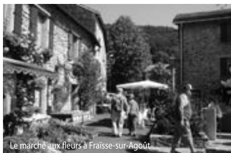
Le marché aux fleurs à Fraïsse-sur-Agoût