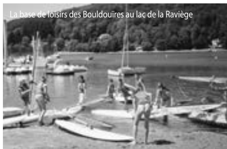
La base de loisirs des Boulidouires au lac de la Raviège