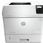
HP LaserJet Enterprise M605dn