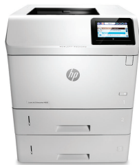
HP LaserJet Enterprise M605x