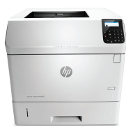
HP LaserJet Enterprise M605n

Générez des résultats professionnels plus rapidement et avec une qualité d'impression exceptionnelle. Gérez facilement de gros volumes d'impression et fournissez à vos groupes de travail les outils nécessaires pour assurer votre succès, où que vous soyez. 2 Gérez et développez facilement les fonctionnalités de cette imprimante ultrarapide et polyvalente, et aidez à réduire l'impact sur l'environnement.