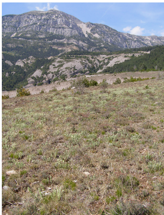
Timoneda amb farigola, herba de la feridura... prop de Canalda (Solsonès). J. Vigo

Timonedes (brolles baixes) dominades per timó ( Thymus spp.), sajolida ( Satureja montana ), esparbonella ( Sideritis scordioides ) o altres labiades (llevat d'espígols), calcícoles, de terra baixa