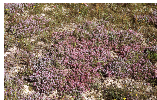
Poblament de Teucrium polium subsp. gnaphalodes . Unitat de Botànica, UB