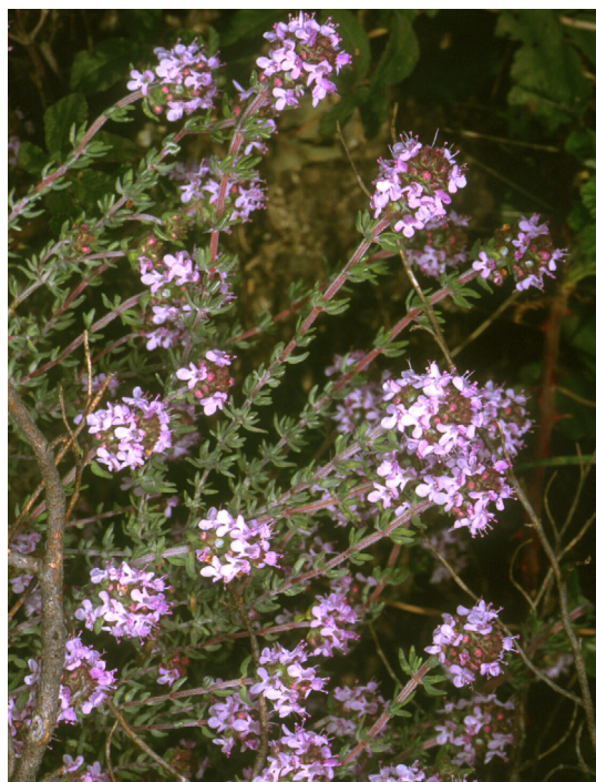
Farigola. X. Font