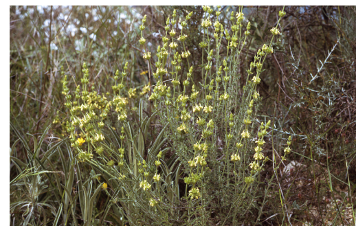
Esparbonella. Unitat de Botànica, UB