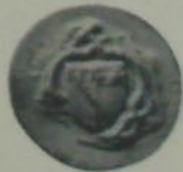
Sceaux et contre-sceaux de PHILIPPE LE HARDI — en 1385, n° 1-2 — en 1370, n° 6 — en 1389, n° 3-4 — en 1403, n° 7 — de la duchesse MARGUERITE DE FLANDRE, en 1403, n° 9 — de MARGUERITE DE S t ETIENNE, nourrice du duc, en 1367, n° 5.