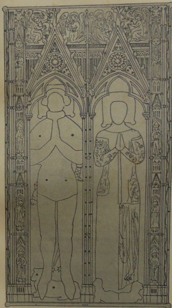
PHILIBERT, sire de BAUFFREMONT, chambellan de PHILIPPE LE HARDI ✠ 1416 et AGNÈS DE JONVELLE, sa femme