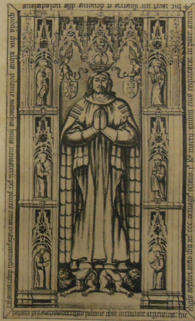
ULADISLAS, duc de Pologne, moine de S t Bénigne, mort le 1 er mars 1389