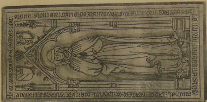
AGNÈS DE MONTROVES, dame de Magny-sur-Tille ✠ 1377 (à l'origine de Dijon)