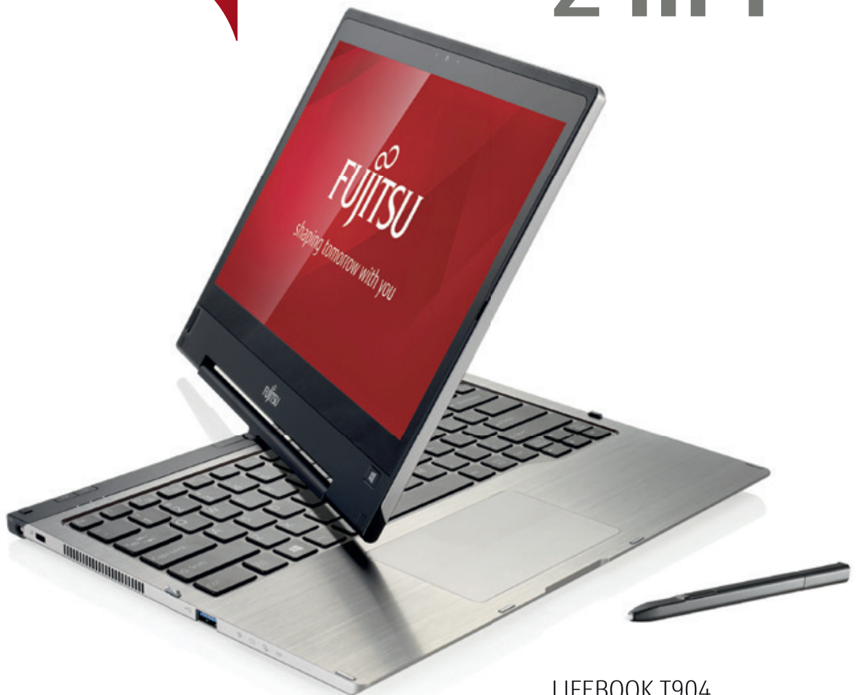
LIFEBOOK T904 Ultrabook neu definiert Seite 9