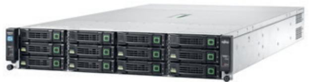
Vorderseite mit 12 x 3,5"-Festplatten