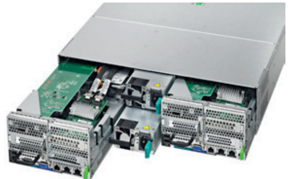
Rückseite mit Server und Netzteilen

Alles ist vorkonfiguriert, vorinstalliert und vorab getestet, um Ihnen innerhalb weniger Minuten nach Erhalt des Fujitsu Cluster-in-a-box eine hochverfügbare IT-Plattform zu bieten.