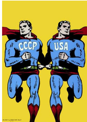
Roman Cieslewicz, affiche CCCP/USA, 1968, impression offset, 81,5x54,5 cm, Musée d'art moderne Centre Pompidou

Ainsi, le pop art s'oppose à toute expression de l'artiste réduit à peindre comme une machine, et s'oppose donc à l'art abstrait et expressionniste, résultats du traumatisme des deux guerres mondiales.