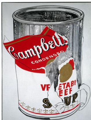
Grande boîte de soupe Campbell déchirée, 1962. Acrylique sur toile