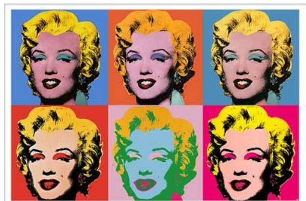
Marilyn, 1967, sérigraphie.