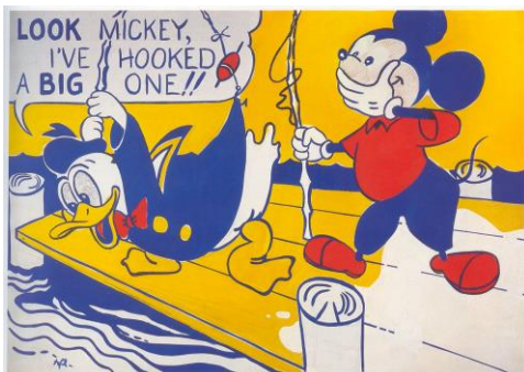
Look Mickey ! , 1961, sérigraphie