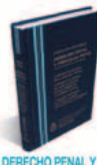
DERECHO PENAL Y PROCESAL PENAL