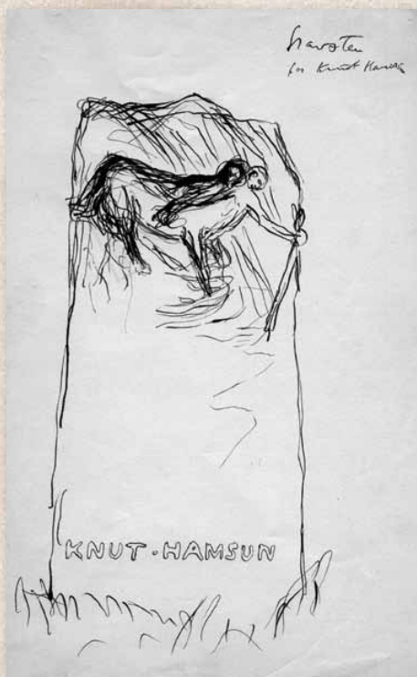
Gustav Vigeland, "Gravsten for Knut Hamsun", udatert. Penn. Vigeland-museet.