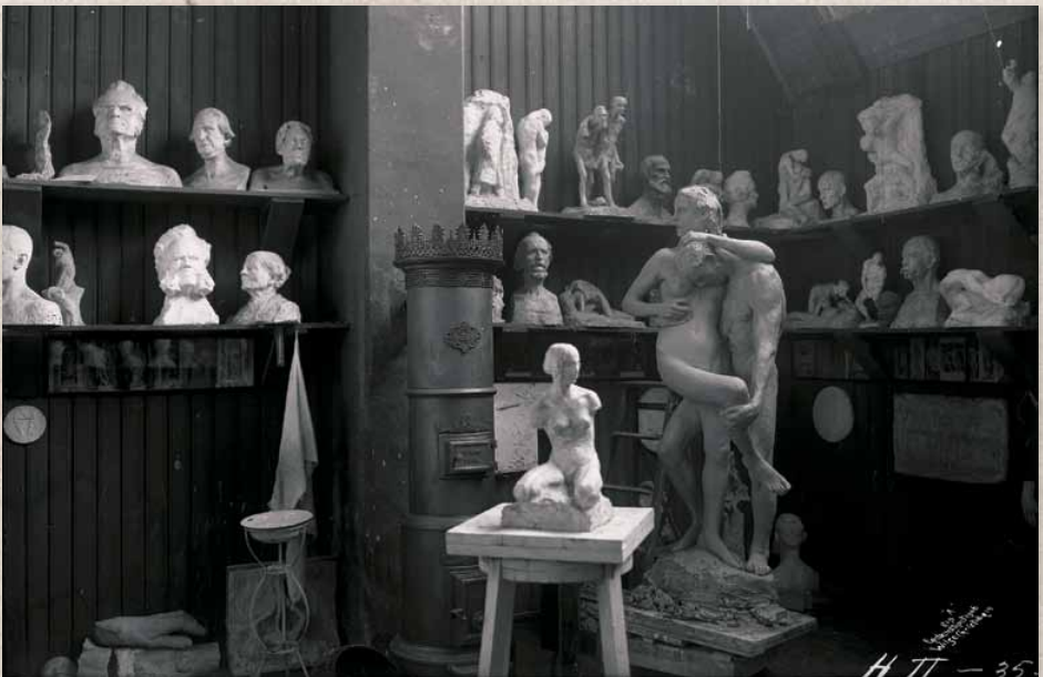
Gustav Vigelands gamle atelier på Hammersborg fotografert før august 1908. Foto: Wilse. Vigeland-museet. Bildet viser hvordan det vrimlet av figurer, hoder og skikkelser, slik Hamsun beskriver det i sitt minneord.

Både forfatteren og billedhuggeren måtte bryte med etablerte tradisjoner for å oppnå det de ønsket. Hamsun eksperimenterte på 1890-tallet med språket, Vigeland med den tredimensjonale formen. I følge Trond Haugen bestod Hamsun sitt brudd i uventede sammenstillinger av verb, adjektiver og substantiver, bruken av absolutte superlativer, nonsensord, fantasinavn og poengterte motsetninger. 13 Vigelands brudd bestod i at han unnlot å modellere detaljene, noe som ga skulpturene en skissemessig fremtoning som av samtiden ble oppfattet som uferdig. For begge