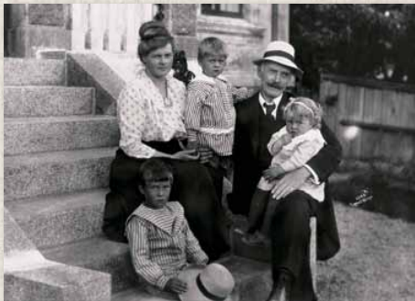
Knut Hamsun med familie fotografert i 1917.

han: "Jeg skulde været inde Lørdag og jeg skulde været inde idag, men blir stadig forhindret. [...] Jeg kommer med det aller- allerførste og glæder mig paa Forhaand til alt! Din Knut Hamsun". 18 To uker senere skriver han at "jeg skal selvfølgelig komme ind efter Busten og takke til – især da jeg med det samme kan faa se Fontæneutkastet. Saa kommer jeg Lørdag [...]". 19 Han ble igjen forhindret. I