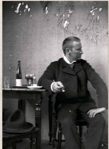
Gustav Vigeland fotografert 27. juni 1903.

på nytt. Hamsun skriver: "Du skal ikke snakke om at gøre en anden Buste, den er absolut brillant naturligvis, den har dit stempel". 17 Hamsun fortsetter spøkefullt "Men du er vel skinsyg paa mig fordi Vigeland har modelert mig og ikke dig, din Stakkar". Hamsun ber i brevet om å få en avstøpning av busten. De hadde det tydeligvis travelt begge to, for først to år senere får Hamsun busten. Planen var at han selv skulle hente denne hos Vigeland i Kristiania. Hamsun hadde på dette tidspunktet flyttet til Drøbak hvor han var i full gang med å bygge hus. 5. september 1905 skriver