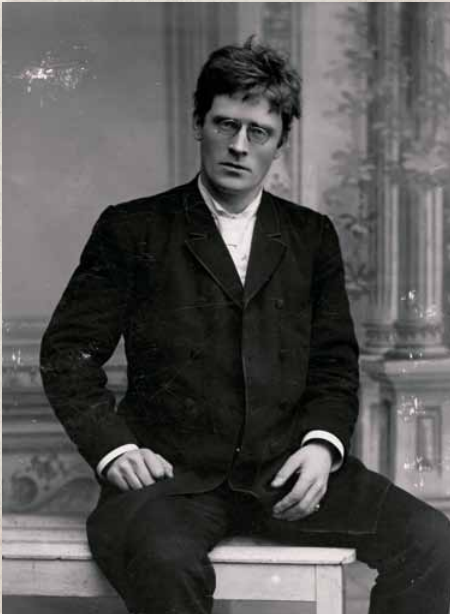
Knut Hamsun fotografert i Kristiansund i 1891 eller 1892.