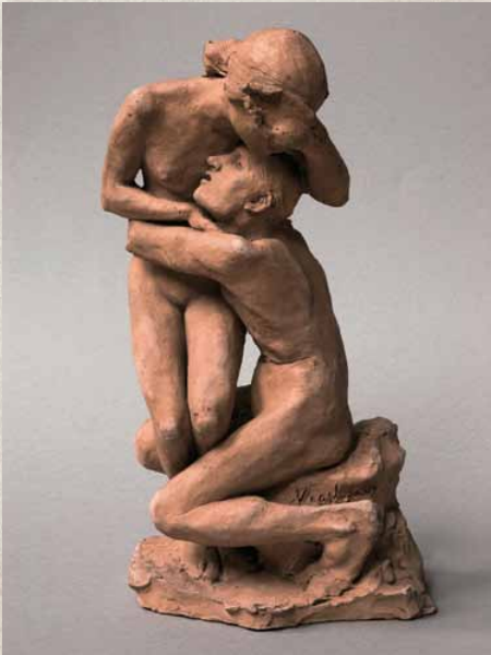
Gustav Vigeland, Mann omfavner kvinne , 1893. Terrakotta. Vigeland-museet.

gjentar han i foredragsserien i 1891, der Ibsen, Bjørnson, Kielland og Lie kritiseres for å bedrive typedikning – de trenger ikke inn i det kompliserte moderne mennesket. Vigeland etterlyser det samme innen billedkunsten. I et brev til Larpent skriver Vigeland om Glyptoteket i København at der er det "[...] Figurer med vildt Haar og flagrende Gevanter. Men ingen Mennesker! Ikke én af alle disse moderne Figurer berørte mig dypt!" 12 Vigeland ønsket i likhet med Hamsun en kunst som trengte ned i dybden av menneskenes sjeloliv.