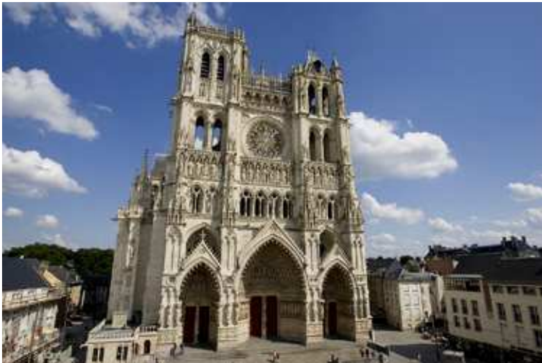
Cathédrale Notre-Dame d’Amiens (XIII e siècle)

Classée au patrimoine mondial de l’Unesco depuis 1981, la cathédrale gothique d’Amiens s’élève en plein centre de la ville. Sa flèche s’élève à 112 mètres du sol. Pour une longueur totale de 145 mètres, un volume intérieur d’environ 200000 m 3 et une superficie de 7 700 m 2 , sa hauteur sous voûte dans la nef atteint 43 mètres. Elle est construite sur un plan en forme de croix latine, avec une nef à bas-côtés, un transept à collatéraux et un chœur à double-collatéraux.