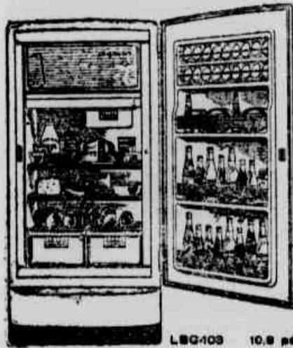
LBC-103 10,8 pés cúbicos

novas geladeiras com côres Internas e maior espaço útil