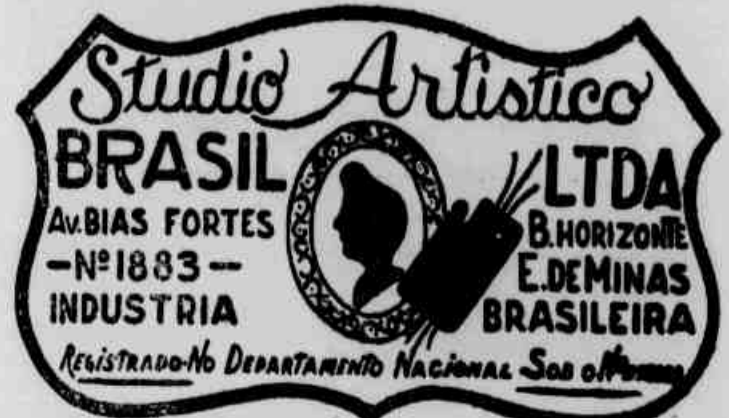
TABELA DE PREÇO CONFIDENCIAL, PARA REVENDEDORES, EXECUÇÃO NO PERÍODO DE 40 DIAS. MATRIZ: AV. BIAS FORTES N. 1.883 — Belo Horizonte - M. Gerais FILIAL: AV. GOIÁS N. 128-A — Goiânia — Est.

AS MELHORES CONFEÇÕES EM RETRATOS DE ALTO LUXO