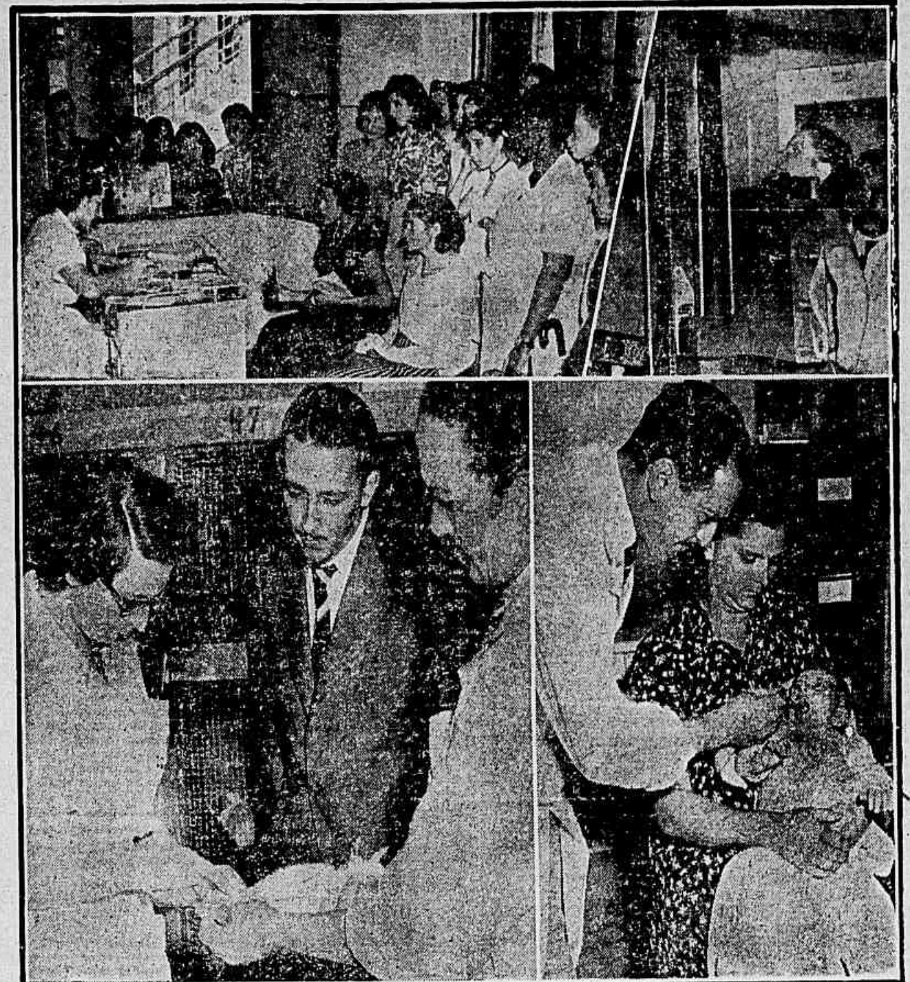
Enorme é a assistência de pessoas à procura dos dispensários e ambulatórios oficiais ou particulares, atendendo assim ao apelo feito pelas autoridades sanitárias de São Paulo. Os aspectos colhidos pela nossa objetiva focalizam as diversas seções do Instituto Clemente Ferreira, onde o serviço se faz gratuitamente. Ao alto, à esquerda, uma radiografia de seus pulmões. Embaixo, na mesma ordem, à direita, uma senhorita servindo-se do aparelho Roentgen, tira uma radiografia de seus pulmões. Embaixo, na mesma ordem, uma enfermeira especializada aplicando líquido gástrico de um paciente numa coberta, para a perfeita digestão do mal de Koch e um dos médicos ministrando vacina BCG numa criança de 8 meses

Exames dos pulmões pelos Raios X e vacina preventiva — Em vigor a lei que exige a vacinação pelo BCG — A produção de vacinas no Brasil