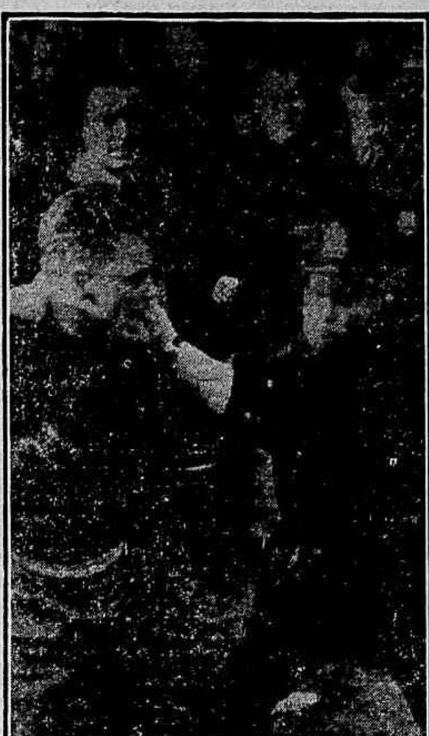
GREVE NA TELEFONICA DE FILADELPHIA — Um policial puxa um grevista a fim de retirá-lo do caminho dos operadores e empregados da Bell Telephone Exchange, que desejam trabalhar. Cerca de 150 grevistas lutaram com a polícia, em Filadélfia, numa tentativa frustrada de impedir os serviços telefônicos.

Todos os condenados residiam na zona soviética da Alemanha, e segundo a agência ADN, confessaram perante o Tribunal terem fornecido informações de