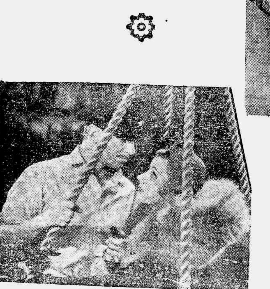
Os clichés acima demonstram algumas cenas do film "O PRAZER DE VIVER", que será apresentado amanhã, na tela do Palacio