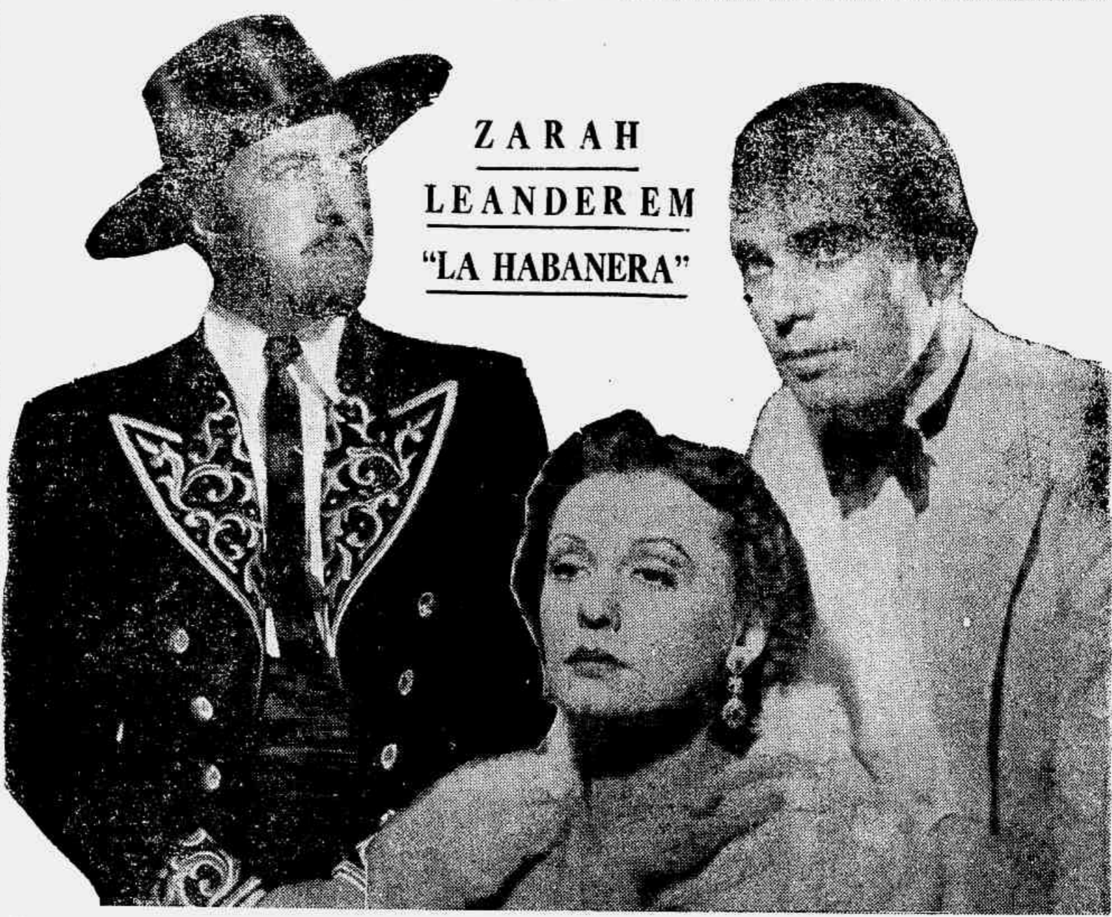
ZARAH LEANDER EM "LA HABANERA"

O triangulo ardoroso em "La Habanera": Karl Martell, o amante; Zarah Leander, a esposa e Ferdinand Marian, o marido brutal e despotico... "La Habanera" é um film da Ufa que vai ser estreado no Odeon