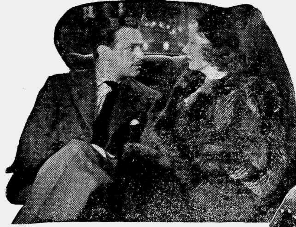
EM QUE CONSISTE A FELICIDADE? Com a palavra Irene Dunne e Douglas Fairbanks Jr. duas creaturas que se consideram felizes!