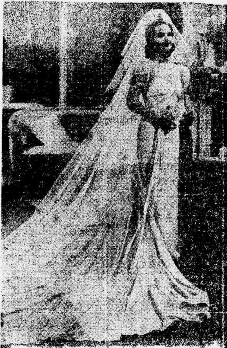
A famosa "estrela" Rochelle Hudson, num lindo vestido de noiva

NOVA YORK, junho (N. P. S. - Especial para o "DIÁRIO DE NOTÍCIAS") - Não deixa de ser audacioso, e até mesmo superfluo, dizer algo ás noivas sobre a beleza, porque a maioria das jovens que se vão casar, procuram conhecer tudo o que há a respeito, uma vez que se apercebem da importância que para si próprias têm todos estes detalhes. E todas se apuram de tal modo, que até parecem anjos... Nunca vi uma noiva que não ficasse encantada, diante do espelho, com a sua radiante beleza. Dado, porém, que beleza e noiva vêm a ser quasi sinónimos, e que nunca se dá demais dissertar sobre uma questão tão palpitante como esta, vou dar alguns conselhos de beleza ás noivas que, por certo, não os receberão mal. Convido as noivas do passado, as que vivem das aces recordações, para as quais elles vêm como um lóculo de beleza florida, a escutal-os. Convido também as noivas do futuro, as que ainda não encontraram o seu "príncipe encantado", a ouvir, sem vacillação, alguns conselhos que, pelo menos sob certo aspecto, poderão levá-las ao pé do altar... Analisemos a questão. Antes de nos lançarmos, porém, á rotina da beleza, devo advertir á noiva