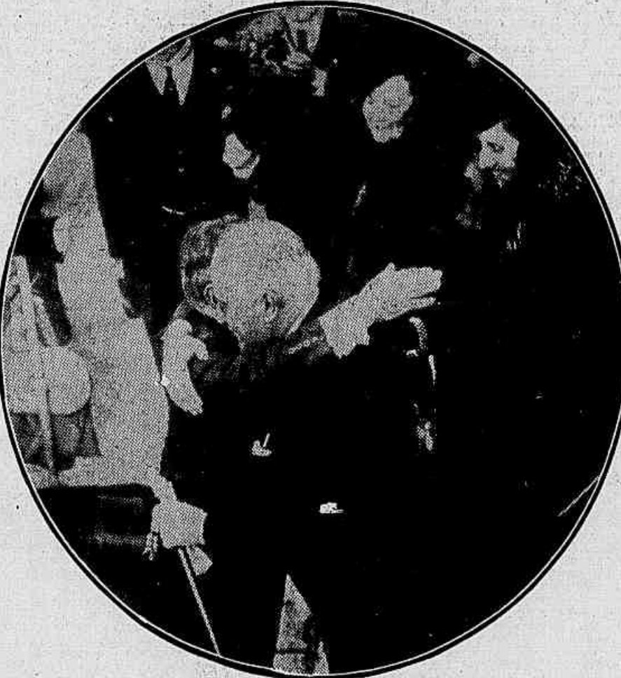
O encontro e o abraço dos dois presidentes. O general Justo dá as boas vindas ao sr. Getulio Vargas.